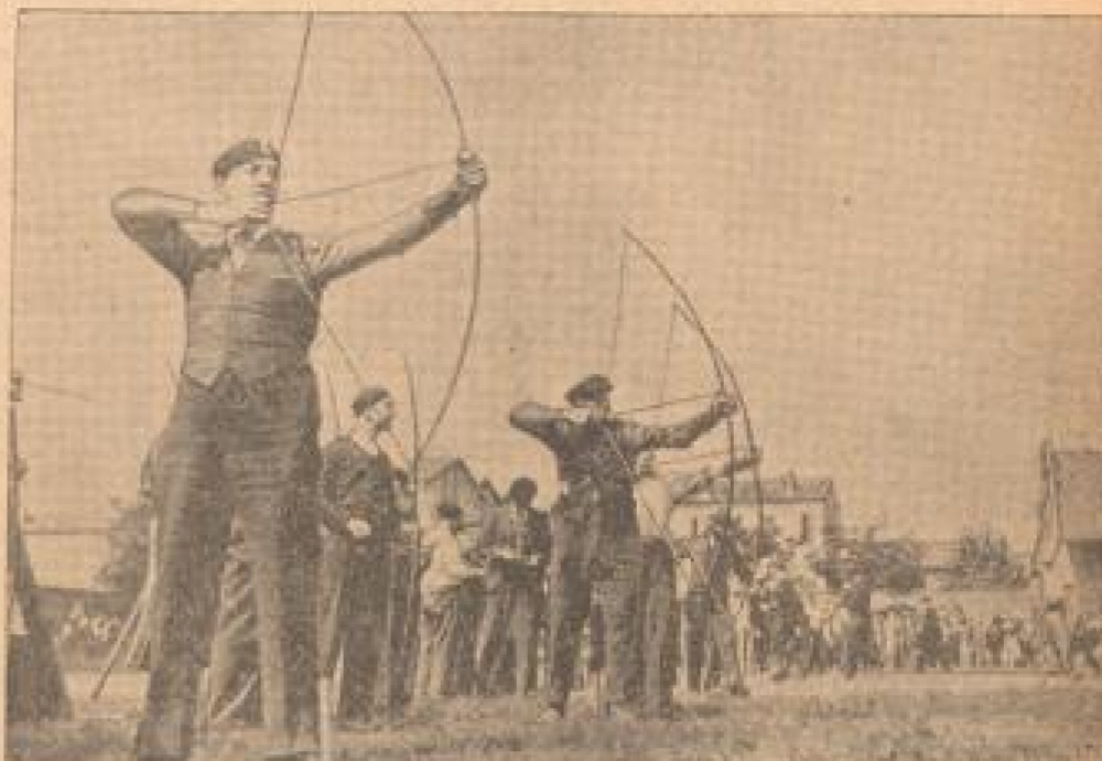
Das Fieß der Bogenschützen in Billomont Hier alljährlich fand in Billomont das große Fieß der französischen Bogenschützen statt, zu dem die Vertreter vieler Nationen aus allen Teilen Frankreichs überbeiegt waren. (Belgrad, N.)