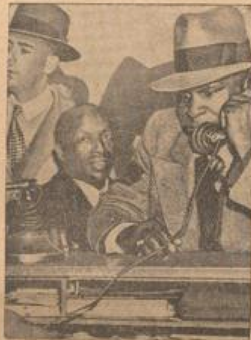
Som „Himmel“ im Gefängnis Der Mann im Bild ist ein Gefangener, der als „Himmel“ bekannt ist. Er sitzt an einem Tisch in einem Gerichtssaal. (Belgrad, N.)