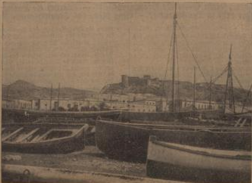
— Paris, 31. Mai.

die Vertreter Englands, Belgiens, der Tschechoslowakei, Frankreichs, Portugals, Schwedens und der Sowjetunion teilgenommen hätten.