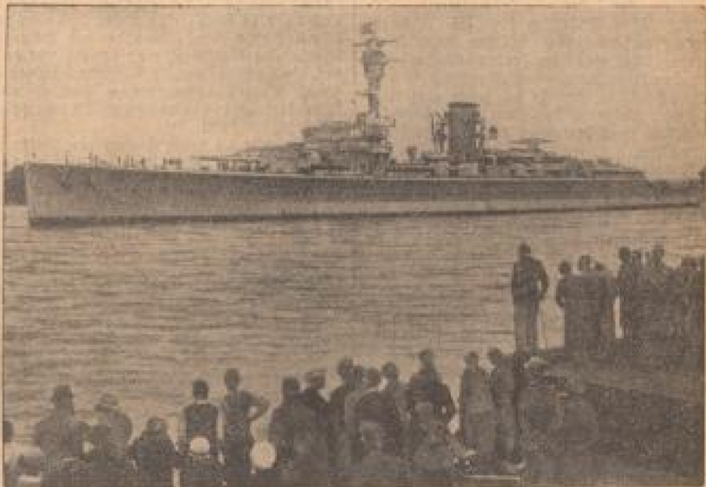
— Paris, 31. Mai.