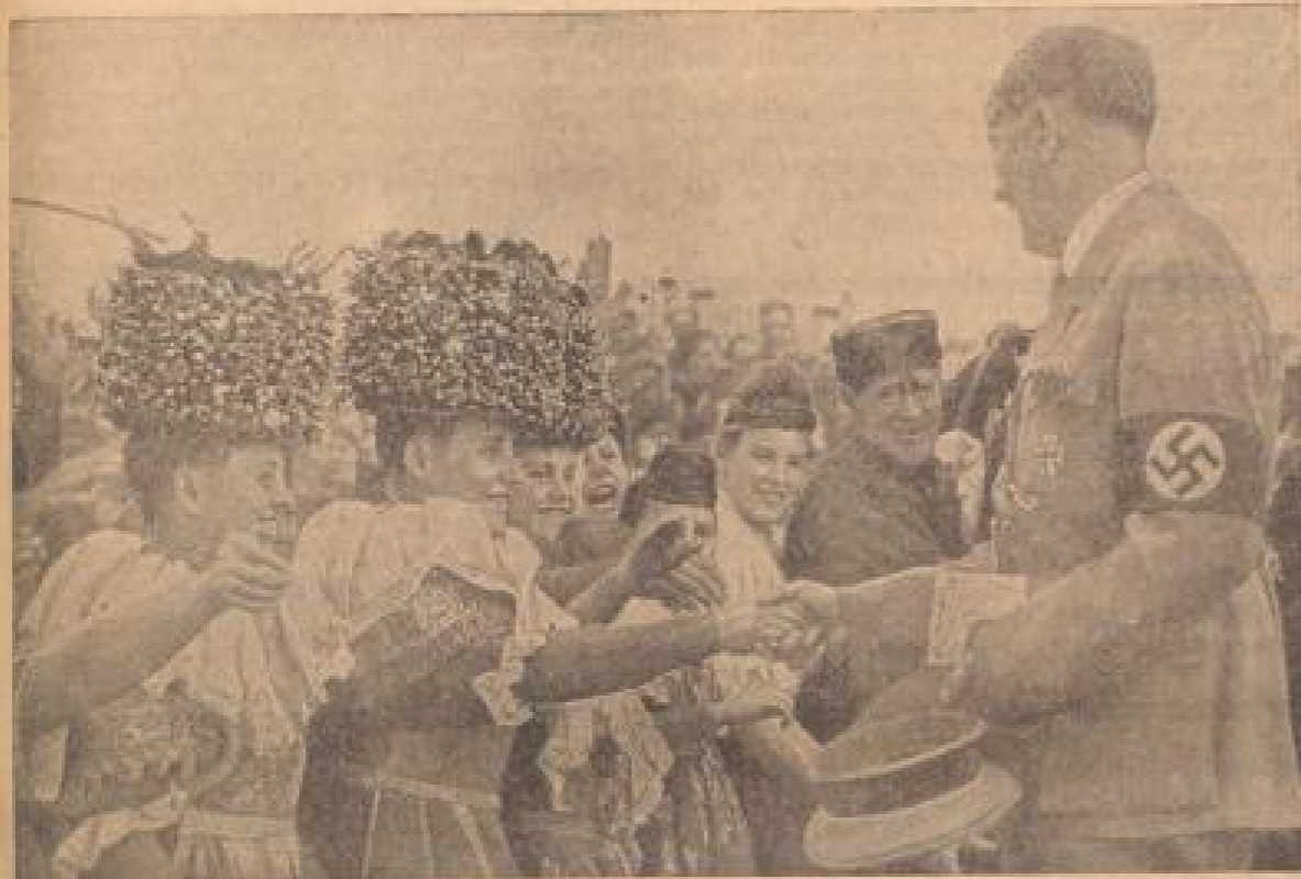
Der Führer und seine Bauern Ein Bild von einem früheren Erntedankfest

hunderttausende deutscher Bauern aus allen Zonen kommen wieder auf dem Bückerberg zusammen, um das diesjährige Weidnererntedankfest zu feiern. Wieder ist der Höhepunkt der Feier vorbrüllende Bergreden der Schanzplatz einer Kundgebung, die seit 1933 würdig in die geschichtlichen Gemeindefestspiele des Dritten Reiches eingereiht hat. Es war der Wunsch des Führers, die Weidnererntedankfest der deutschen Bauern nicht in Ausschauenden haltenden zu lassen, sondern in der herrlichen freien Natur, verbunden mit der Landschaft, mit dem heimischen Boden, so wie der Bauer seit Jahr und Tag diese Verbindung fühlt und erlebt, in diesem Zeichen sollte auch jenes Fest leben, das kein unteilbares ist. Die Wahl des Bückerberges bringt die Erfüllung dieses Wunsches. Das herrliche Land um den Bückerberg ist mit unvergleichlicher Schönheit und als Stätte reicher Geschichte der erlebenden Feier seinen würdigen Rahmen. Der Name Bückerberg wurde in wenigen Jahren zum Symbol für den Erntedank des deutschen Volkes. Er weckt freundlichen Widerhall im Herzen von Hunderttausenden, die sich nach der Arbeit eines Jahres nun um den Führer scharen und aus seinem Munde Richtung und Ziel für die Zukunft hören.