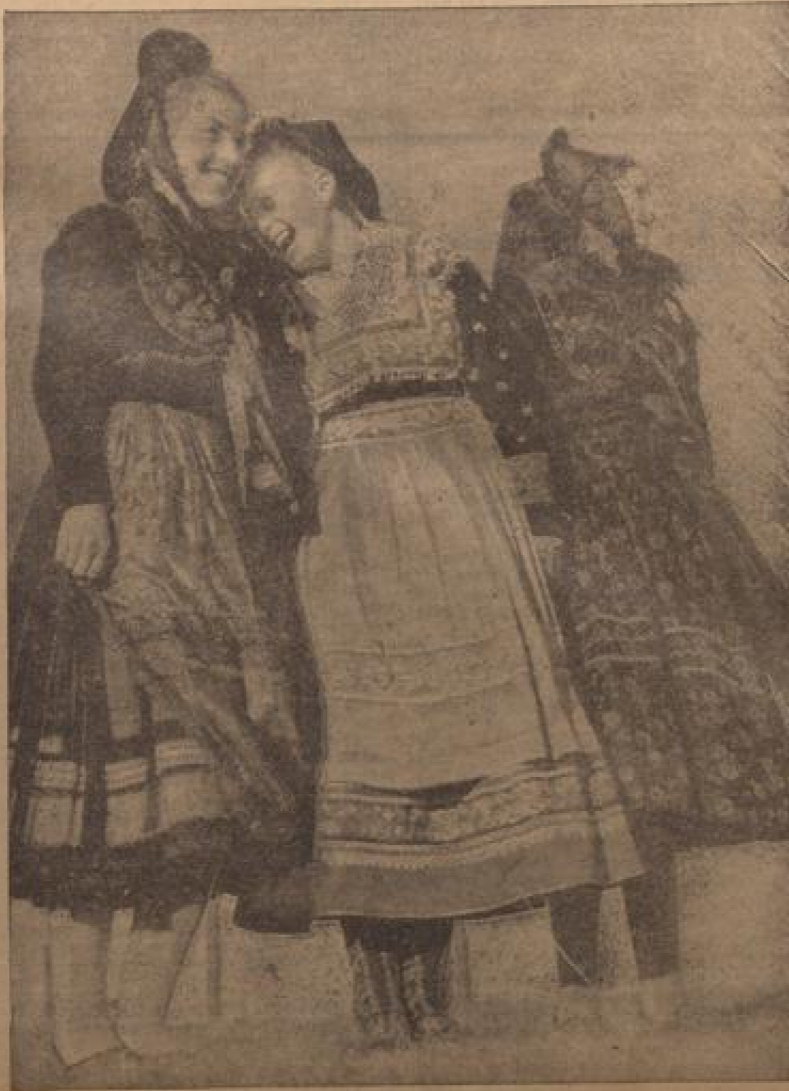
Mädchen aus Kurhessen auf dem Bückerberg

(Fortsetzung auf Seite 4 der Sonntagsbeilage)