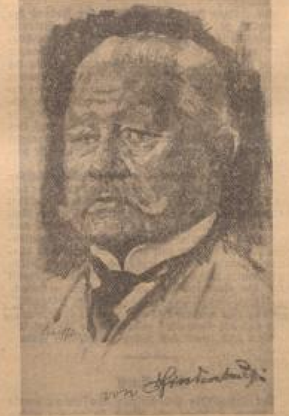
Die in ständiger Sitzung entstandene Porträtskizze ...