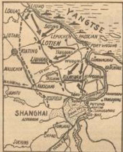
Der Einbruch in die Schanghai-Front