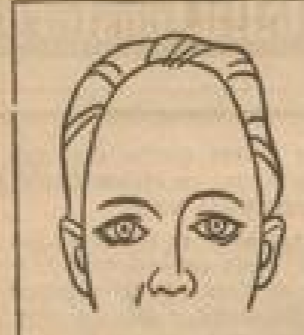
Abb. 1: Glatte, hohe Stirn