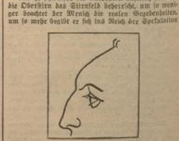
Abb. 6: Flache Stirn