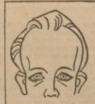
Abb. 3: Runden Stirn