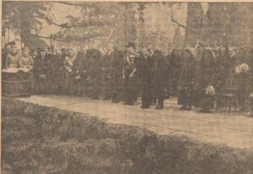
Die Beisehung der Opfer von Ostende in Darmstadt