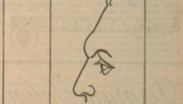
Abb. 5: Flache Stirn