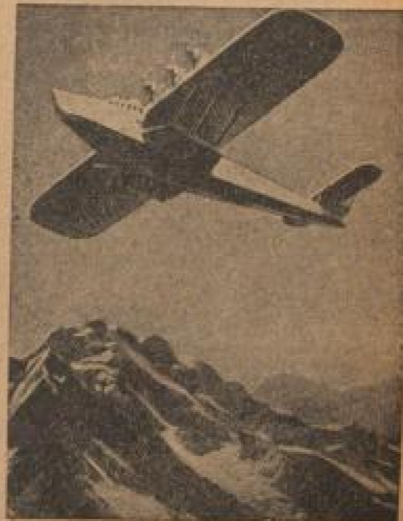
Das hätte sich Blériot nicht träumen lassen... daß ein Reford über die Alpen in unseren Tagen kein Problem mehr ist. — Unser Bild: Eine Do X 3 aus dem Jahre 1931.

Über die Schwierigkeit der Vorbereitungen für den deutschen Refordflug macht man sich immer einen Begriff. Obwohl die Refordmaschine, die mit einem „DB 600“-Motor ausgestattet war, schon längst fertiggestellt war, mußten dennoch,