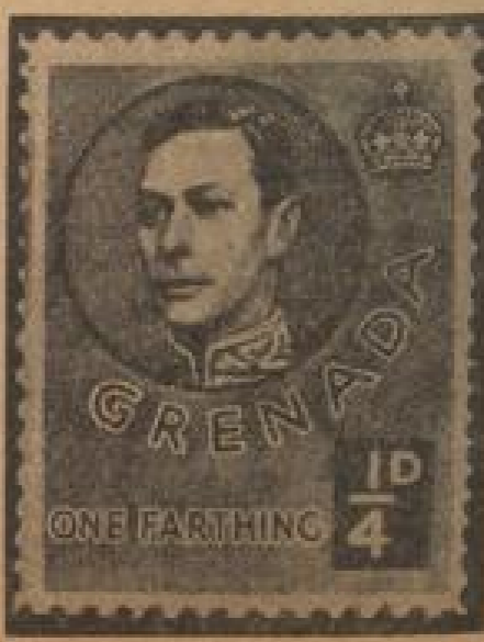
Neue Marke der westindischen Insel Grenada mit dem Bildnis des englischen Königs.