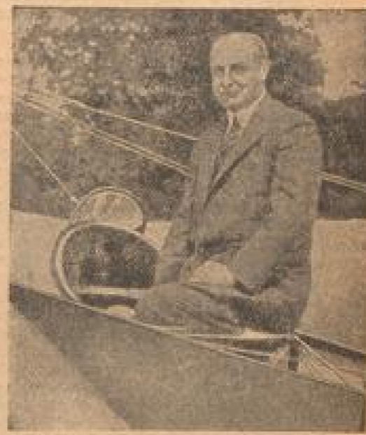
Louis Blériot flog 1909 mit 78 Stundenkilometer den Schnelligkeitsrekord.

Der Brasilianer erreichte 1906 mit seinem Flugapparat eine Stundengeschwindigkeit von 41 Stkm. Dieser Tage schuf der Deutsche Dr. Wurster den Weltrekord mit 611 Stkm.