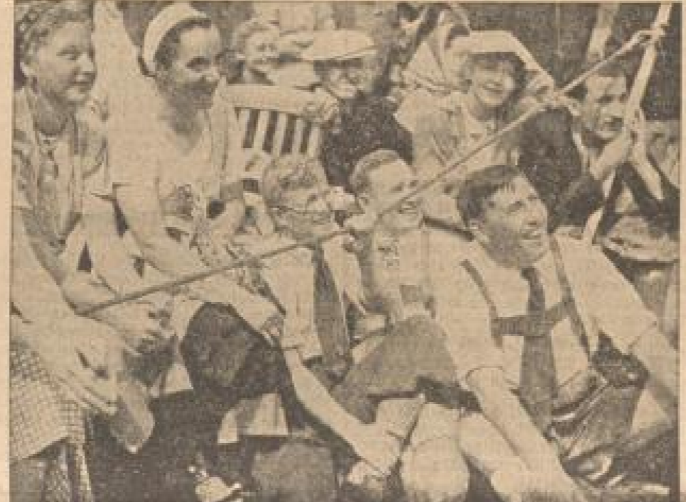
Eine Seife, die ist lüftig! Große Packung an 200 Stück...