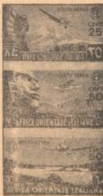
Neue italienische Kolonial-Briefmarken. Die neue Serie der indischen Ostafrika-Kolonien. (Kritik Kander, R.)

Weinander verbunden ergeben diese Buchstaben einen bestmöglichen Holzwand.