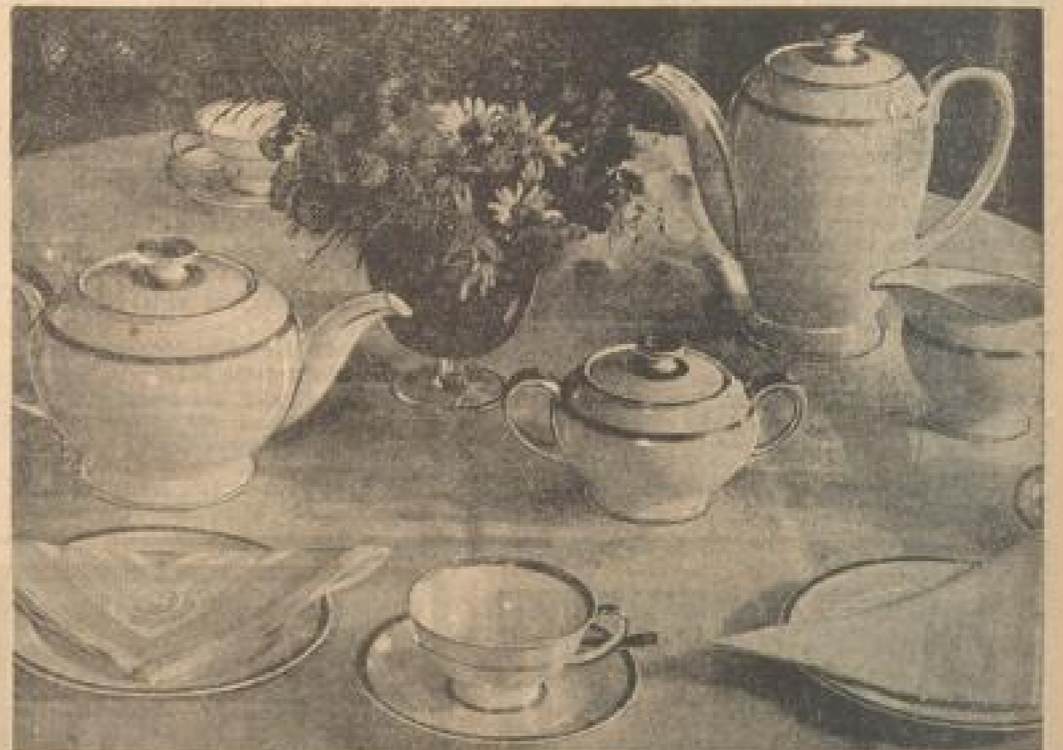
Oben: Immer schön und zeitgemäß ist die Tischwäsche zu einem Tischdecken wie diesen, deren starrer Reiz in einer weichen Gestaltlichkeit besteht. Unten: Die streng, schlichte Form des modernen Porzellans wird zugleich ausstrahlend und aufgelöst durch die weichen Schümel der in sich gewundenen Schalen- und Tellerformen, die in geschmeidiger Rundung mit Blumenschalen und Geschirren eine harmonische Einheit bilden, die nicht gefühllos Tisch

Einmalig gilt aber auch für das moderne, strengste Zweckgeschirr die Grundtatsache, daß es nur dann schön sein kann, wenn ihm wirklich keramisch empfundene Formen eigen sind. Und die keramisch empfundene, also dem Werkstoff der weichen Erde gemäße Form wird immer eine gewisse Weichheit der Linie, immer die feinen Schwünge und plastischen Rundungen brauchen, um alle reizvollen Gestaltungsmöglichkeiten auszunutzen und damit zugleich auch die Feinheit des Materials voll zur Geltung zu bringen. Denn dies ist einer der größten Vorzüge deutschen Markenporzellans: daß es schon in seinem Erben von einer kaum irgendwo in der Welt erreichten Qualität ausgedehnt und daher dann auch jene höchste Veredelung des Werkstoffes beanspruchen kann, die ihm durch vielfältige, oft bis zu 50 vom Hundert, handwertlich angeführte Werkvorgänge zuteil wird.