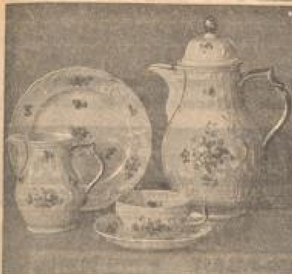
Wie das Dekor den Charakter der klassischen Barockform auflockert...