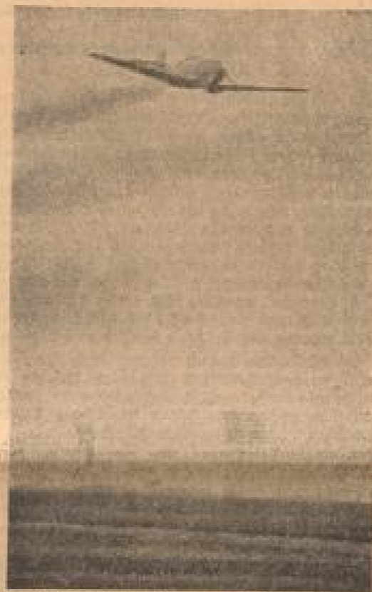
Das ist die deutsche Messerschmitt-Rekordmaschine, aufgenommen bei 611 Kilometer Stundengeschwindigkeit. Nicht einmal der schnellste Verschluss des Fotoapparates kann das Flugzeug scharf erfassen.

Im Jahre 1906 startete ein in Frankreich lebender Professor Alberto Santos-Dumont nach langen Vorbereitungen zu einem Flug, bei dem er über eine Meile von 200 Meter eine Stundengeschwindigkeit von 41 Kilometer erreichte. Santos-Dumont ist damit als erster Refordpilot in die Geschichte der Luftfahrt eingegangen. Aber bereits ein Jahr später gelang es einem Franzosen, mit dem hier mehrfach genannten Namen Henri Farman, die Stundenleistung auf 52 Kilometer zu verbessern. Noch zwei Jahren beteiligte sich der bekannte Pilot Blériot an dem Wettbewerb und schaffte die Leistung auf 78 Stundenkilometer, eine Geschwindigkeit, die heute jedes Kleinflugzeug erreicht. Die Größe des Motorfluges schien zunächst abgeschritten zu sein. In den folgenden Jahren geschah nichts Bedeutliches. Erst im Jahre 1910 wurde zum erstenmal die 100-Kilometer-Grenze überschritten. Es war der Pilot Moran, dem in Mainz diese Leistung gelang. Größere Verbesserungen des Refords erfolgten erst im Jahre 1912, wo die Stundengeschwindigkeit ebenfalls von französischen Piloten auf 145 und 187 Kilometer verbessert wurde. Ein Inzessjahr vor dem Kriege war die heute noch ausschlaggebende Geschwindigkeit von 200 Stundenkilometer erreicht. Es war der Franzose P. v. n. n., dem es in Chicago gelang, 200 Stundenkilometer zurückzulegen.