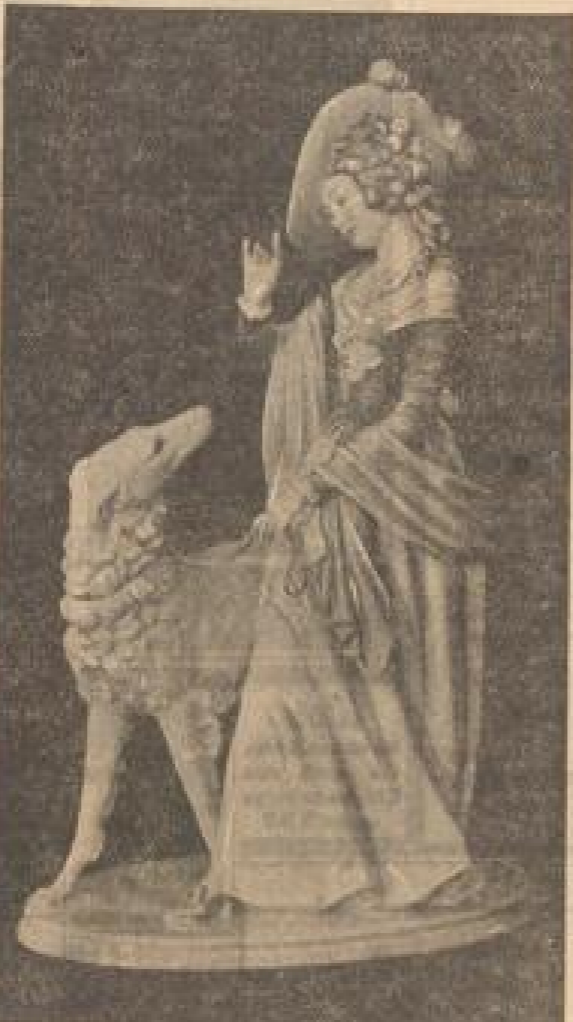
Dame mit Windhund, Porzellanplastik von Gustav Oppel