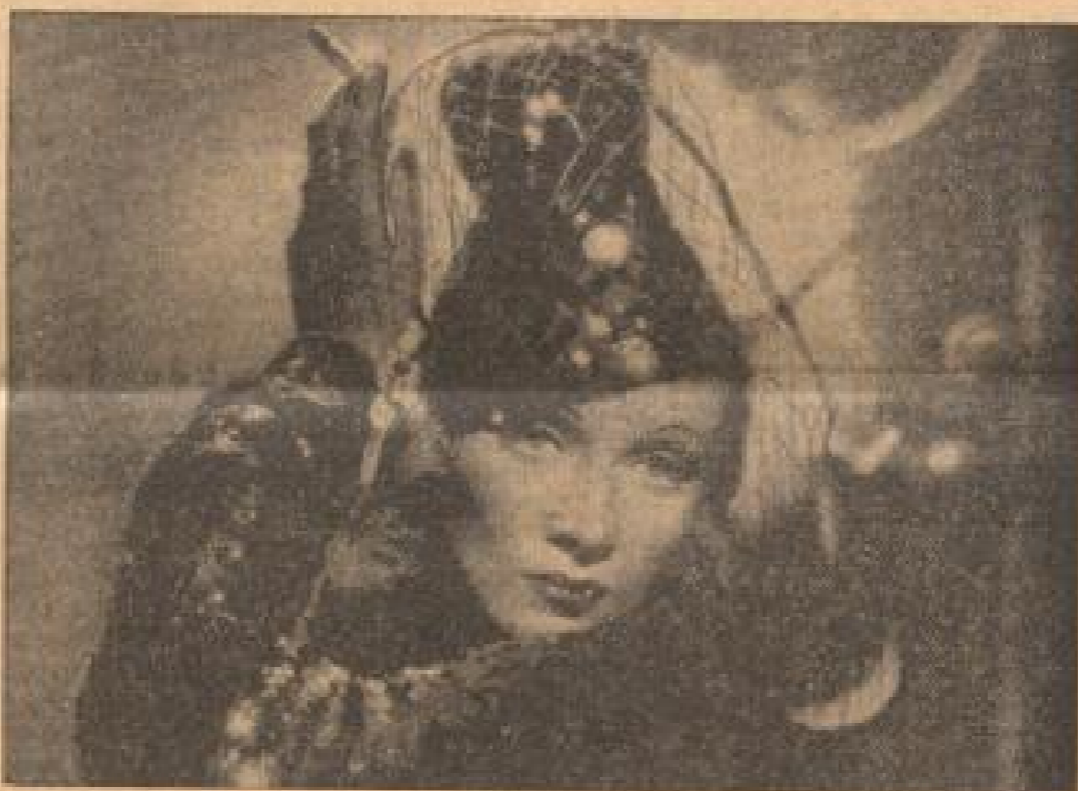
Karlene hat genug von Hollywood... Karlene Dietrich will nicht mehr in Filmen auftreten, die ihr nicht liegen. Eine wird sie auch in Amerika verlassen, um dann nach Europa zurückzukehren. (Kritik Kander, R.)

Zur Erinnerung an die ersten Nationalen Olympischen Spiele im August erschien eine Gedenkmarke von drei Werten. Sie zeigt einen Diktator vor der Landesflagge. 1 (centavo) grün/blau/rot, 2 (centavo) violett/blau/rot, 7 (centavo) hellblau/rot.