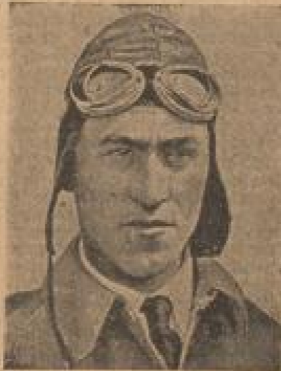
Der Inhaber des absoluten Schnelligkeitsrekordes ist mit 709 Stundenkilometer der Italiener Agello.

zu gewinnen. Ein Refordflugzeug hatet und beendet den Reford unter ganz anderen Bedingungen als eine Refordmaschine. Das Niedergehen auf eine unbedeutende Refordhöhe erlaubt eine viel höhere Refordgeschwindigkeit, als bei ein bestmöglicher Refordflug möglich. Es wirken bei beiden ganz andere Kräfte, deshalb sind auch die Refordstrecken für beide Maschinen sehr verschieden geartet. Refordstrecken davon ist die hohe Refordgeschwindigkeit einer Refordmaschine überhaupt nur möglich, weil man die Flügel im Reford verstellen und so die Refordgeschwindigkeit berechnen kann.