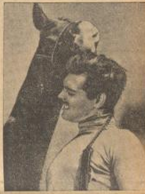
Er frist ihm die Haare vom Kopf

In diesen Tagen feierte die Deutsche Seemannsschule auf der Mittel- und Ostsee des 75. Jahrestages. — Mitglieder der Seemannsschulen beim Empfangen der Fahnen. Im Hintergrund der Gebäude der Seemannsschule.