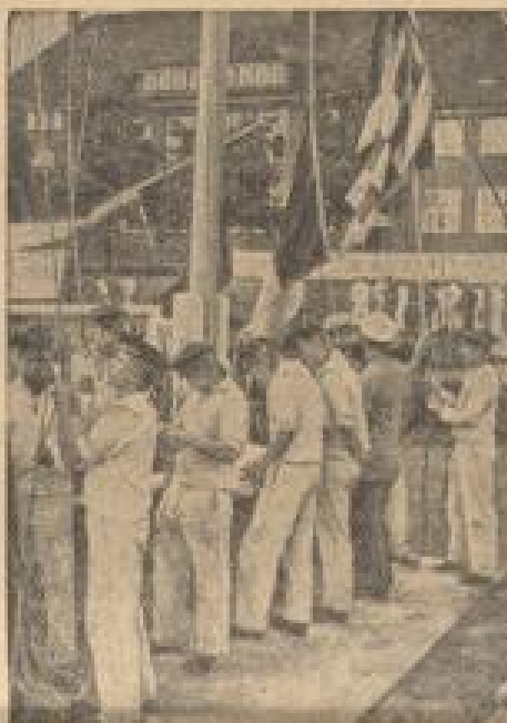
75 Jahre Deutsche Seemannsschule

Das ehemalige Vinterschiff „Schleswig-Holstein“ ist als Schulschiff angemietet auf einer großen Auslandsreise begriffen, und hat kürzlich den Hafen von Teneriffa auf den Kanarischen Inseln an. Die dortige Bevölkerung begrüßte das stolze Schiff.