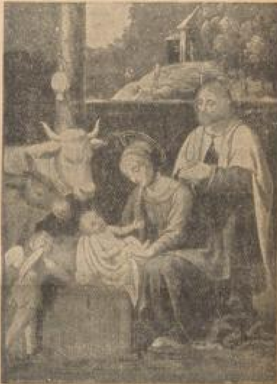
Bernardino Luini: Die Geburt Christi

wäre. Von Königslein aus habe sie ihm noch einmal geschrieben, er habe sie acht Tage warten lassen, um ihre Spannung bis ins Unerträgliche zu steigern. Dann war das Telegramm von ihm abgegangen worden. Er hatte nicht mehr geantwortet. Die Antwort kam. Würde keine Antwort, aber ein Ablehnen des Pro fessors eingegangen, so würde er einen Bruch mit Camilla ausgedrückt haben, um in den Besitz einer Deckung zu gelangen.