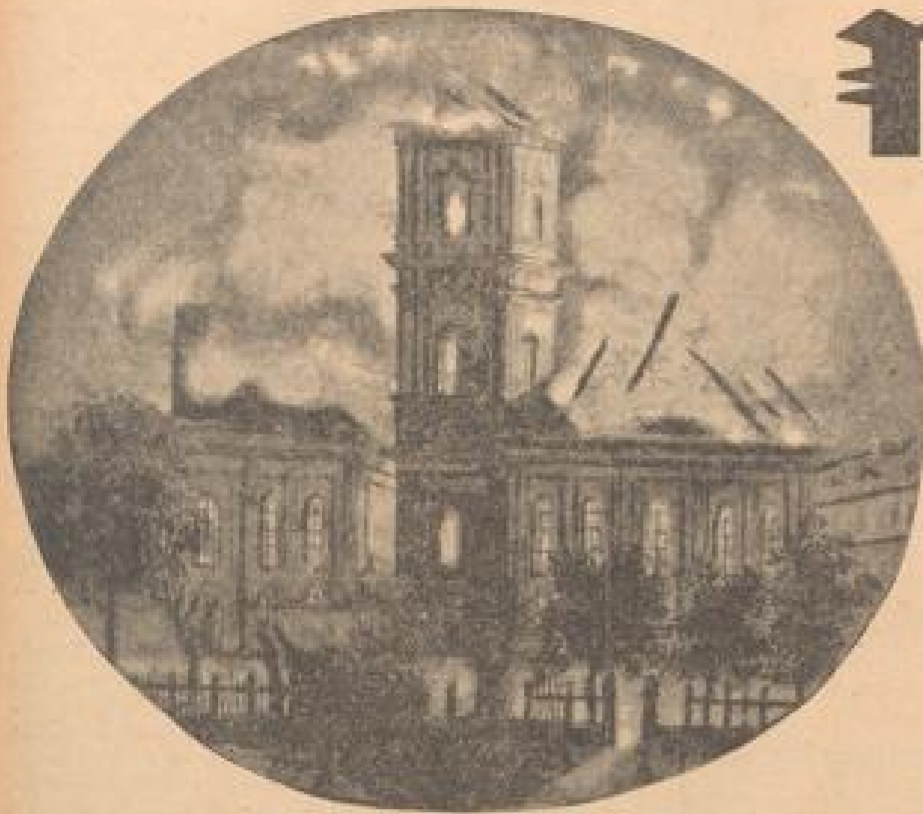
Wie die Festung und Residenz der Kurfürsten von der Pfalz in drei Kriegen belagert wurde — Tilly stürmt die Stadt — Granaten hageln im November 1795 — Zwischen Sanskulotten und Kaiserlichen

Wie das Opernhaus in Flammen aufging Eine österreichische Bombe zündete in der Nacht vom 21. Novbr. 1795. Das kurfürstliche Oper- und Ballhaus wurde durch das Feuer völlig zerstört.