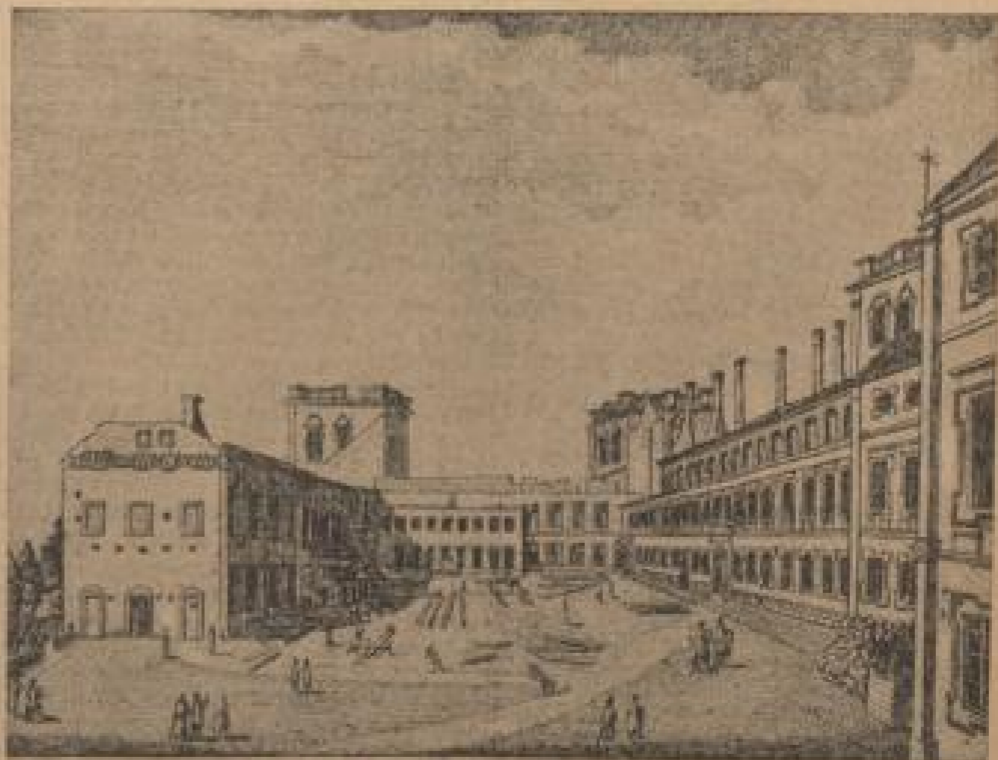
So sah der linke Flügel des kurfürstlichen Rheinschlusses nach der Beschädigung im November 1795 aus