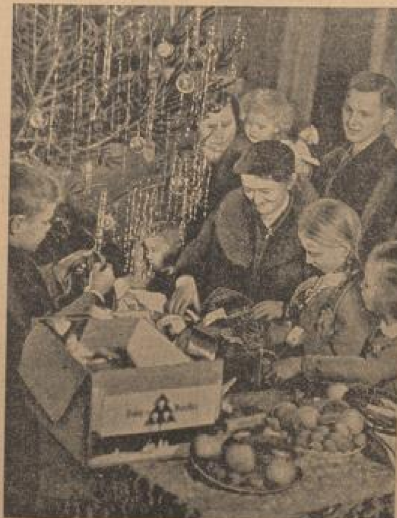
(Kreierle, Seite 6.)