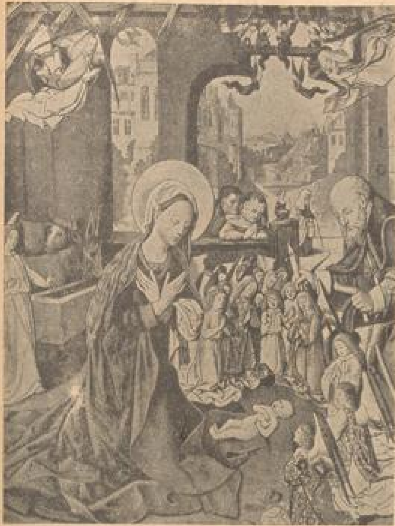
Meister der „Vorherrlichung Mariä“. Anbetung des Christuskindes.