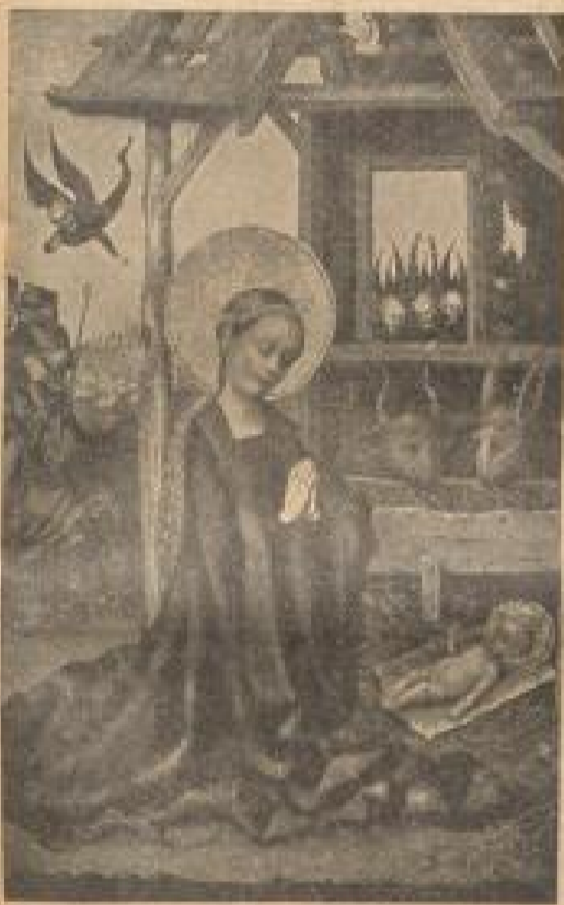
Stefan Lochner: Die Anbetung des Kindes

Jahrtausende sind seitdem ins Sand gegangen. Das Weihnachtsfest hat in seiner Bedeutung für uns nichts verloren. Im Gegenteil, sie ist ge wachsen. Unzähliges Neues ist dazugekommen, was uns dieses Fest zauberhafter Schönheit stets mit Freude erwarten läßt.