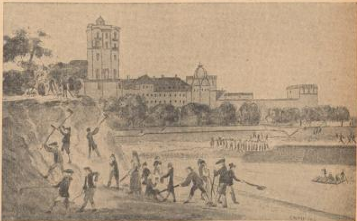
Die Schleifung der Festungswälle Anno 1790 Die Bürgerschaft nahm selbst an der Demolierung der Fortifikationen teil — Im Hintergrund Schloß und Sternwarte

Wie das Opernhaus in Flammen aufging Eine österreichische Bombe zündete in der Nacht vom 21. Novbr. 1795. Das kurfürstliche Oper- und Ballhaus wurde durch das Feuer völlig zerstört.