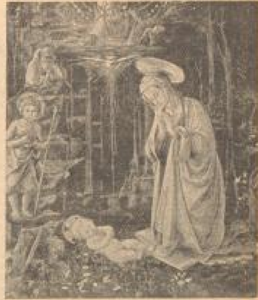
Fra Filippo Lippi: Christgeburt Das aus der Frühzeit des Florentiner Meisters stammende Werk steht noch deutlich unter dem Ein druck des frommen Malermöchers Fra Angelico.

Weihnachten! Immer kehrt es wieder und nimmt uns trotzdem gefangen mit seinem unbeschreiblichen Zauber, wie kein anderes kirchliches Fest. Es bedeutet die herrliche Erinnerung an die Kindheit und erfüllt noch den Erwachsenen mit dem Geheimnis des Geschehens, das sich da einst vor 2000 Jahren trug. Die Mythe des Weihnachtsfestes hat natürlich auch den Künstler ge reizt, und seitdem zum erstenmal die historischen Worte der Weihnachtsgeschichte aufgezeichnet wurden, haben Künstler, sei es, ob sie das Wort oder das Bild zum Mittel ihrer Darstellungs kraft machten, das weihnachtliche Geschehen nachzuschaffen versucht. Das Weihnachtsfest ist in der Form, wie wir es heute feiern, ja noch nicht so alt. Aber trotzdem steht die Christgeburt bereits im Mittelpunkt der Malerei des Mittelalters und des Mittelalters.