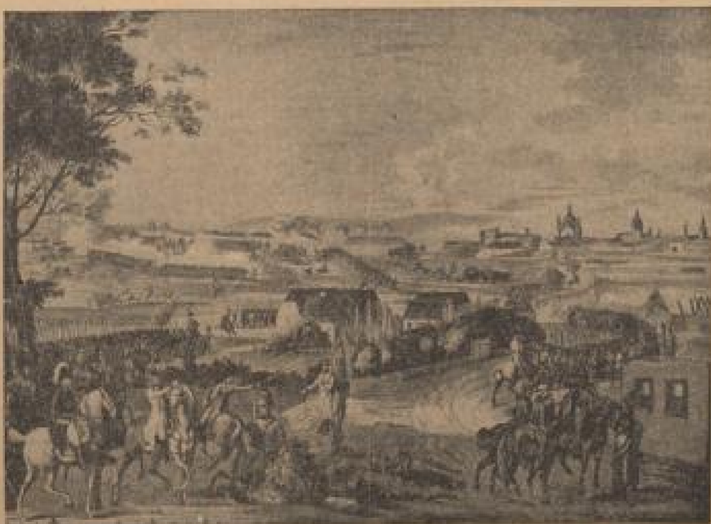
Eroberung Mannheims durch die Oesterreicher am 18. September 1795 Nach einem farbigen Stich von J. L. Rugendas

(Fortsetzung auf Seite 6 der Sonntagsbeilage)