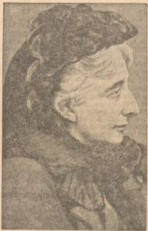
Cosima Wagner (Walden 1832)