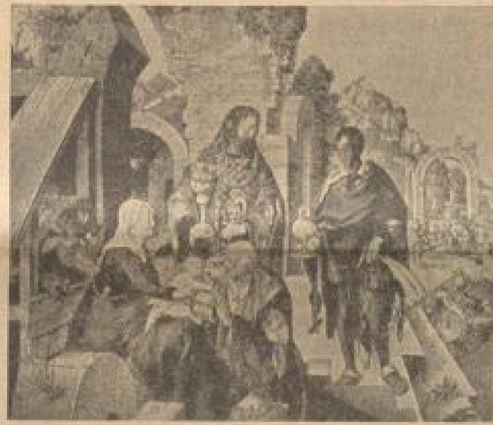
Albrecht Dürer: Die Anbetung der Könige