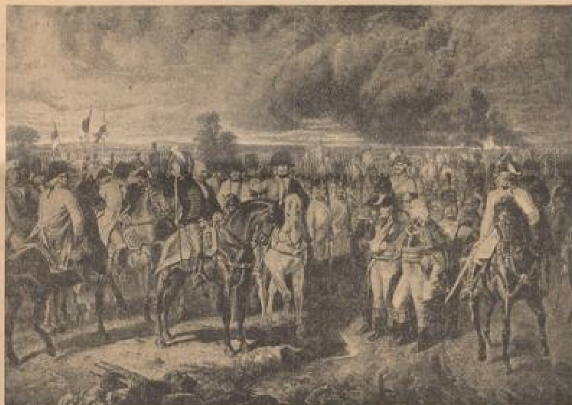
Übergabe der Festung Mannheim und Gefangenahme der französischen Besatzung am 23. Novbr. 1795 In der Mitte der österreichische Heerführer General Graf Wurmser, Rechts (zu Fuß) die französischen Generale. Daneben Oberstleutnant Kiensau. — Im Hintergrund: Gewaltige Brände in der Stadt.