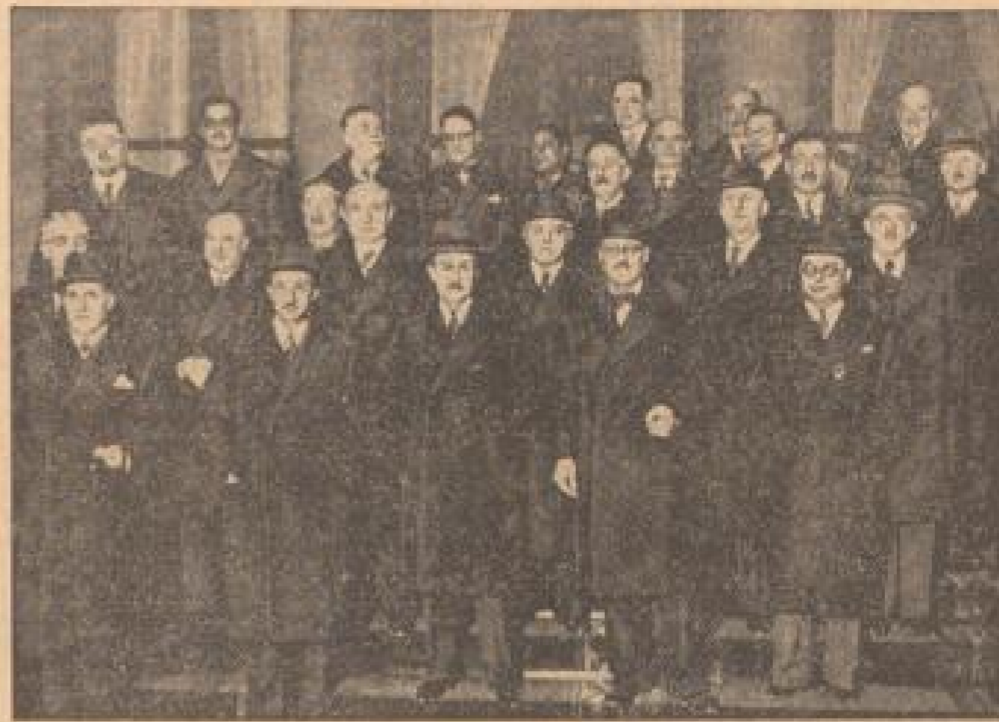
Das neue Kabinett Chautemps präsentiert sich der Kamera