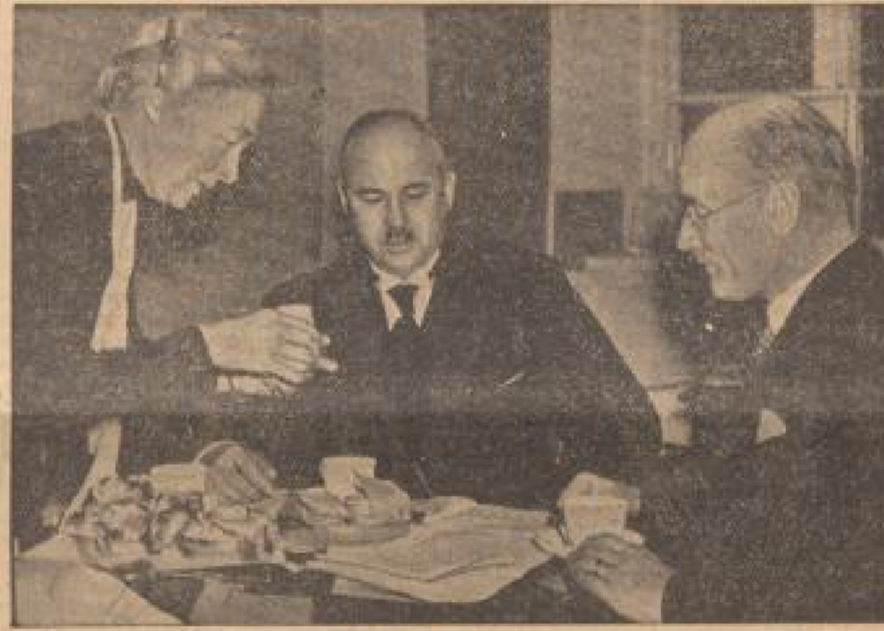
Selbstbedienung im Reichslagerrestaurant