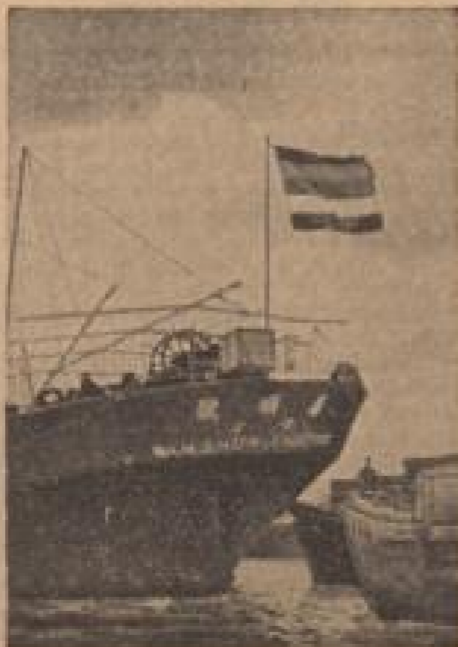
Die fünfstöckige ...