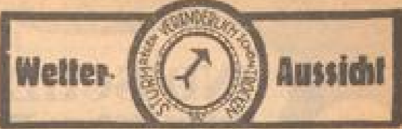
Wetter-Aussicht der Reichsmeteorzentrale Frankfurt a. M.

Ein Ausfall auf dem Eiseis Kanade - Schweden, das ganz überraschend von Kanada mit nur 2:8 gemessen wurde.