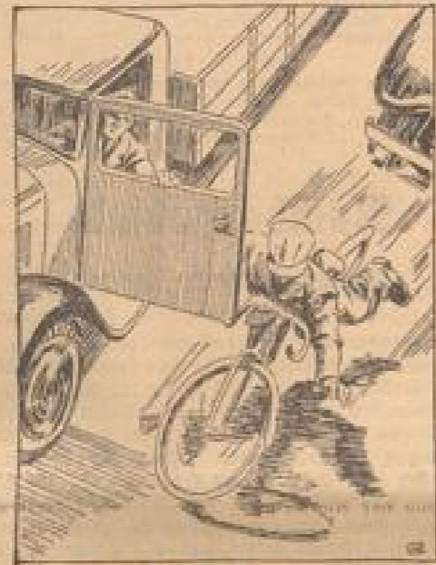
So im Stau - alle Bitte! Mußt du's hoch, dann Rücklicht, bitte! Zeichnung: Rob-Verschaar (Quert.)