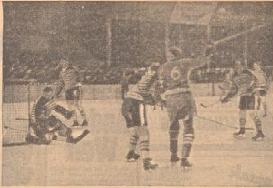
Eisshockey-Weltmeisterschaft in Prag