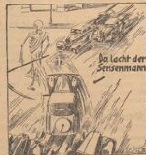
Da lacht der Sensenmann Zeichnung: Rob-Verschaar (Quert.)