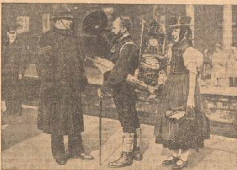
Schwarzwälder Trachtengruppe besucht die englische Hauptstadt

In der Jubiläumstag der englischen Touristikvereine nahmen auch zahlreiche ausländische Trachtengruppen teil. . . .