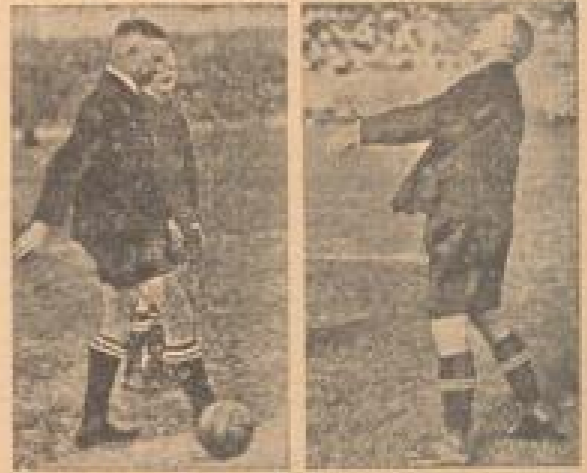
Deutsche Fußballspieler für die Fußballweltmeisterschaft ...