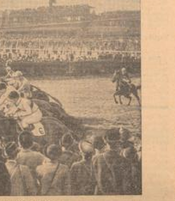
Start zum größten englischen Hindernisrennen ...