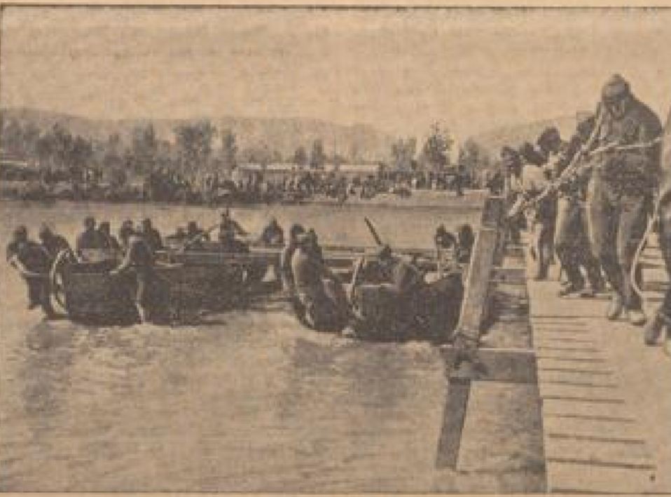
Nationalistische Planer über dem Meer, nachdem die vorstehende Brücke von den Barcelonatruppen bei ihrem Rückzug zerstört worden war.