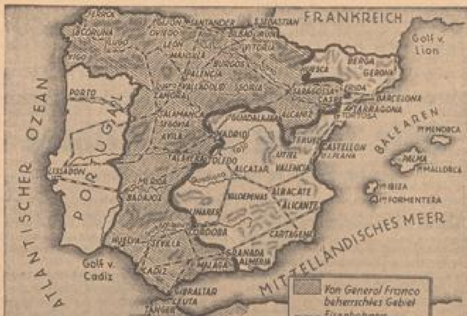
Die General Franco's Truppen im Nordwest bekannntes hat die nationalen Truppen in Tortosa eingebracht. Katalanien wird damit in zwei Teile geteilt, und die letzten Straßen und Eisenbahnverbindungen Barcelonas mit Valencia und Madrid werden damit unterbrochen.