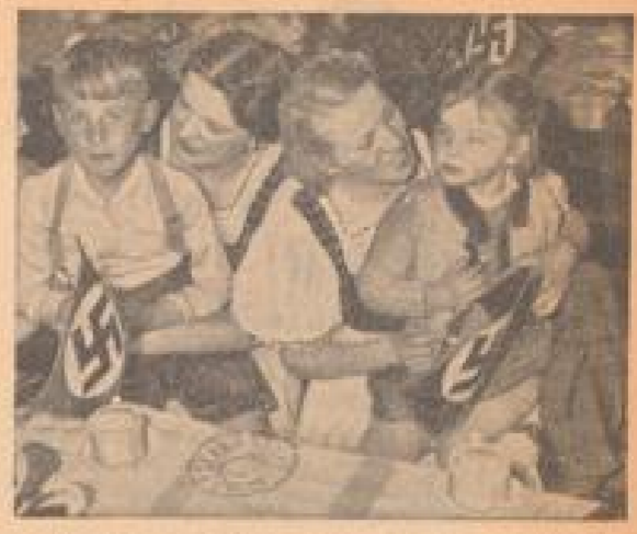
Die Wiener Volkshauskinder im 20. Jahrhundert. Die Kinder sitzen an Tischen und arbeiten an ihren Schularbeiten.

ausgeben. Der Gouverneur habe sich aber geweiht und fordere eine gerichtliche Entscheidung, die ihn allein von jeglicher Verantwortlichkeit entbinden könnte.