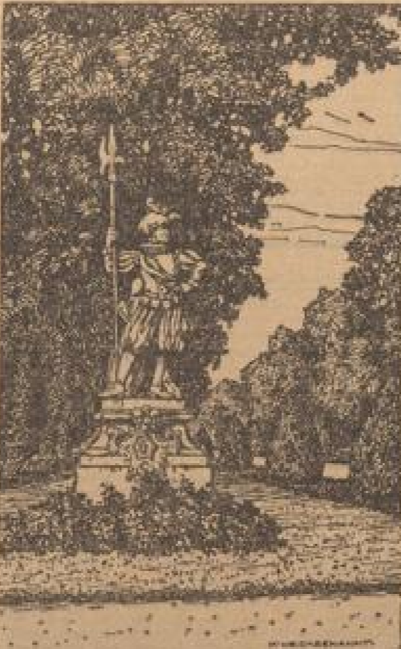
Bruchsal - ein Barockjuwel. Hellebardenträger im alten Schlossgarten.