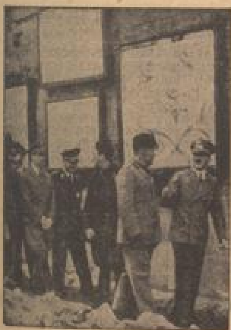
In Begleitung des Duce besucht der Führer die Aufstellungen der Deutschen bei Kaiserlichen Mann.