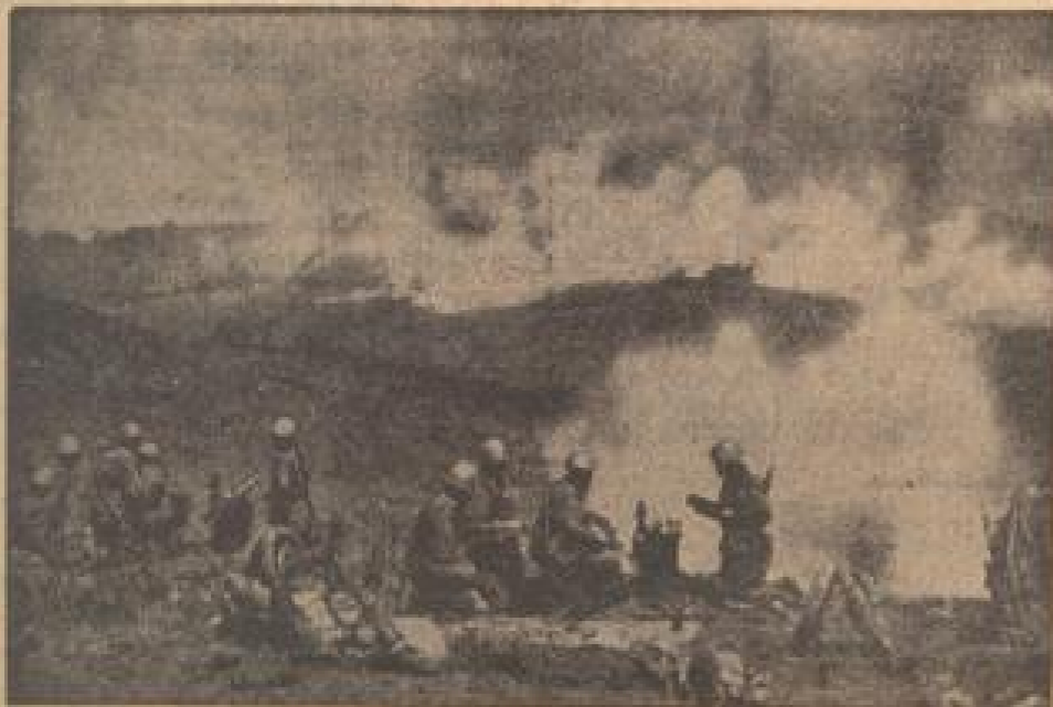
Die Manöver in San Marino. Die Richtung wird bestimmt gegeben. (Presse-Dienst, Sonder-Multicolor-R.)