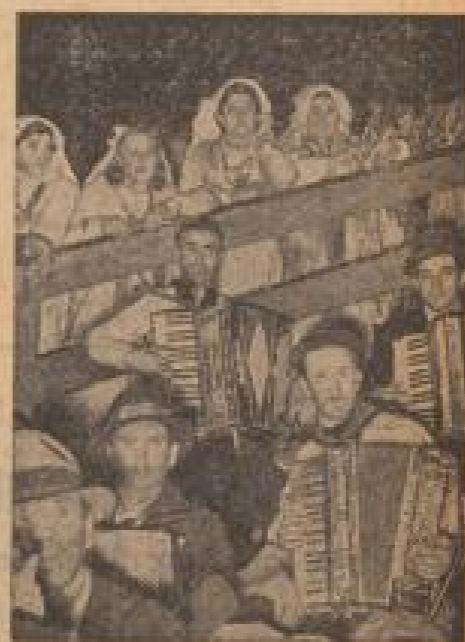
Musikalisches Festspiel der Anstaltenden in der Hallen des Nationaltheaters. (Bildnachricht, Sonder-Multicolor-R.)