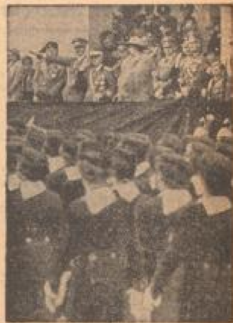
Mädchen der italienischen Heeresakademie in ihrer schwarzen Uniform während des großen Parades vor dem Quirinal. (Pressefoto, Sonder-Multicolor-R.)