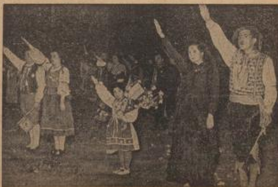
Italiens Bevölkerung grüßt die deutschen Gäste.