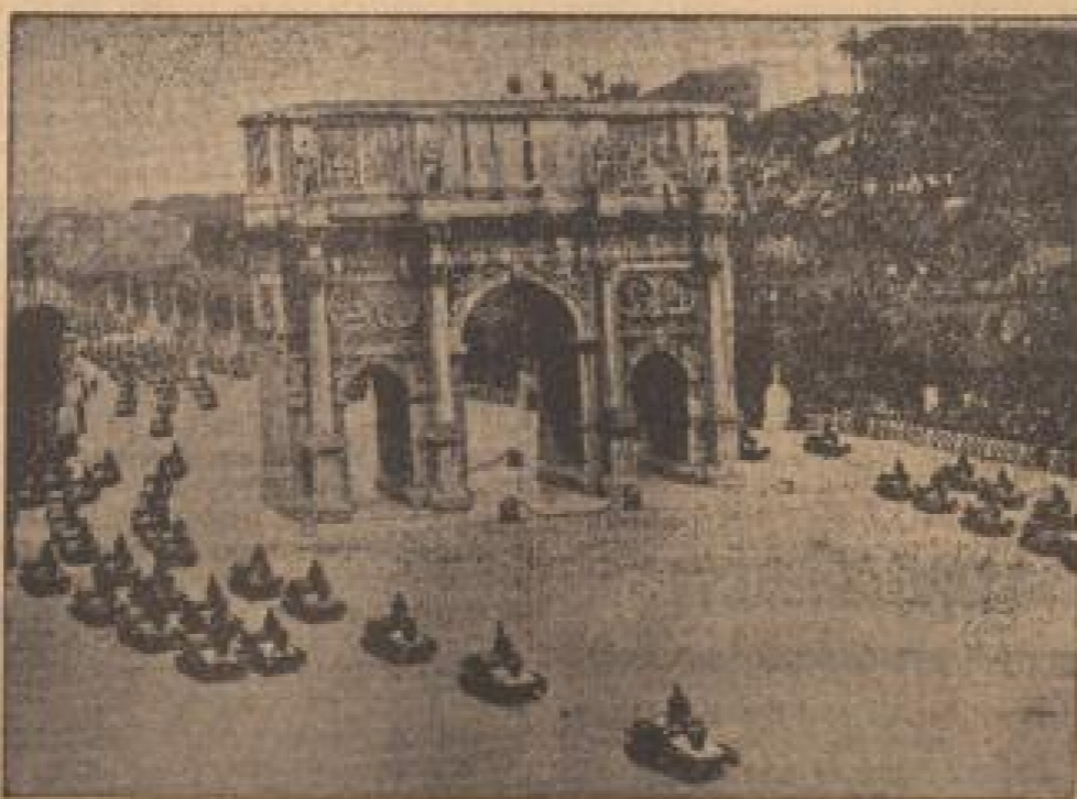
Paradenzüge am Via dei Fori Imperiali. (Bildnachricht, Sonder-M.)