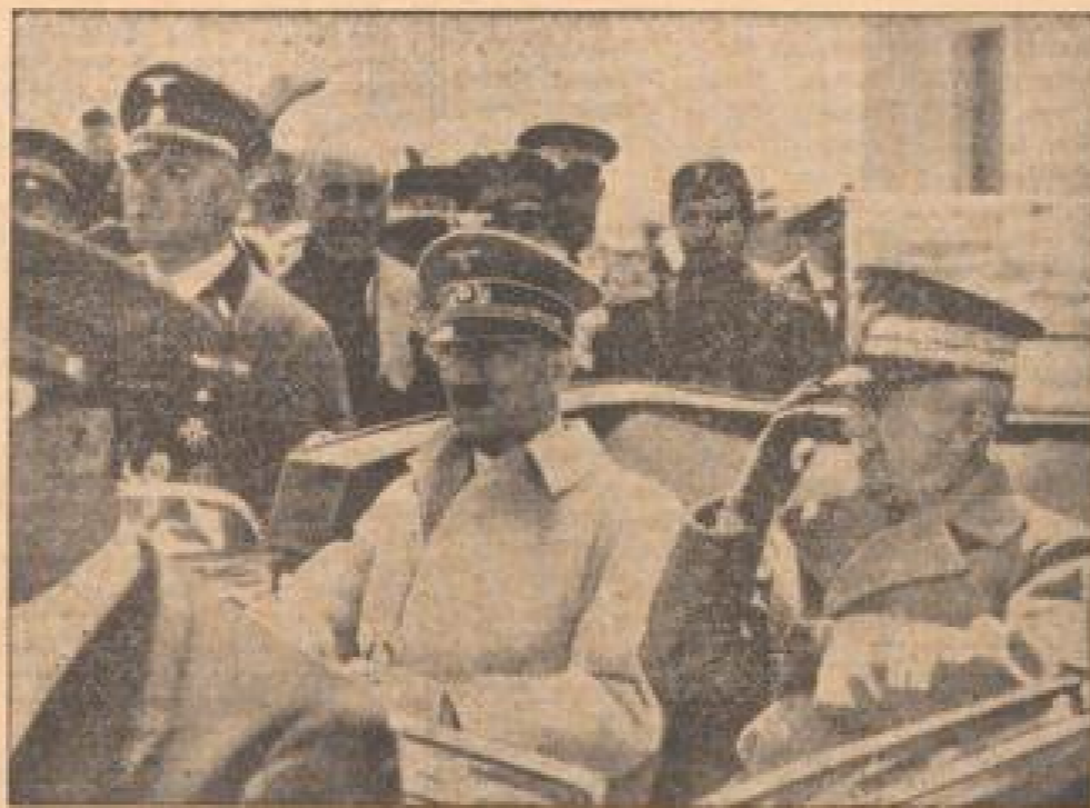
Der König von Italien und Benito von Mussolini reist mit seinem Hof zu den Übungen der italienischen Luftwaffe in Fuzara ein.

Marchierende Kolonnen, jubelnde Menschen und Truppen im harten Manöverkampf