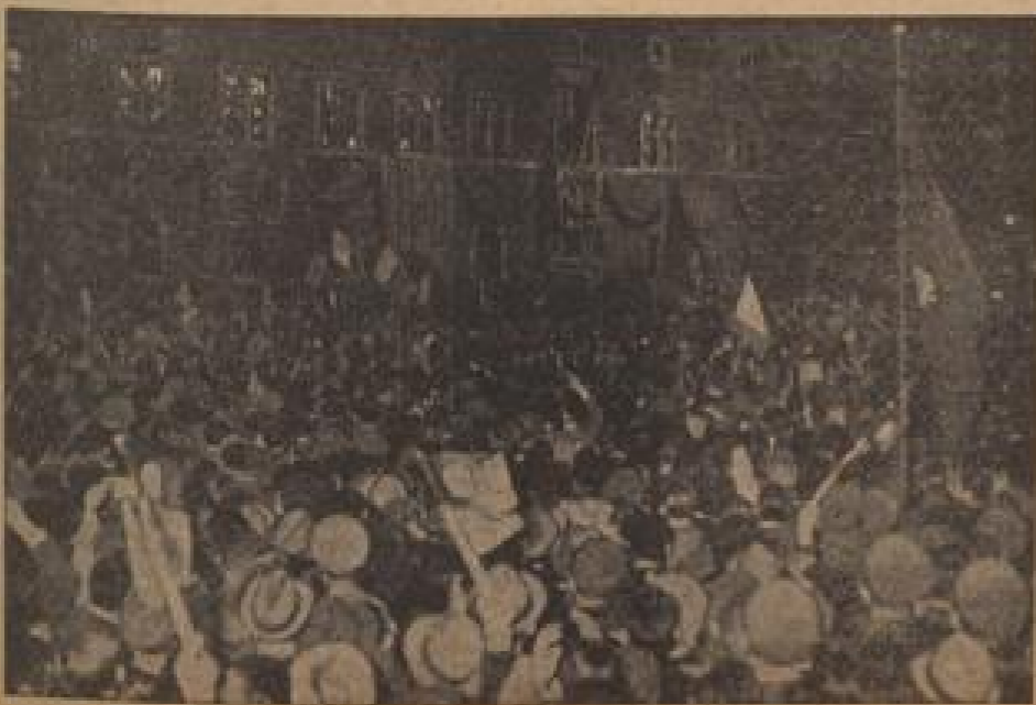
Durch den Führer nach den Toren vor dem Palazzo Venezia. (Bildnachricht, Sonder-Multicolor-R.)