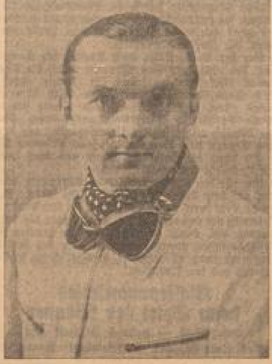
Hermann Lang, der Sieger von Tripolis

Das gleiche Schicksal ereilt sich auch einige der größten Rennwagen. Die Teilnehmer sind: 1. Mercedes-Benz, 2. Mercedes-Benz, 3. Mercedes-Benz, 4. Mercedes-Benz, 5. Mercedes-Benz, 6. Mercedes-Benz, 7. Mercedes-Benz, 8. Mercedes-Benz, 9. Mercedes-Benz, 10. Mercedes-Benz.