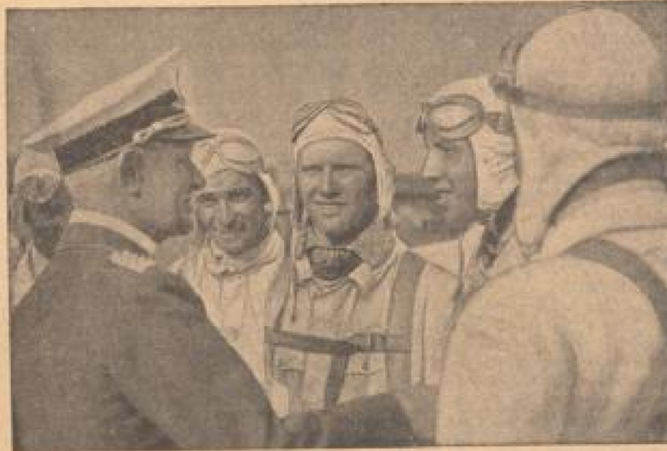
Vor dem Deutschlandflug