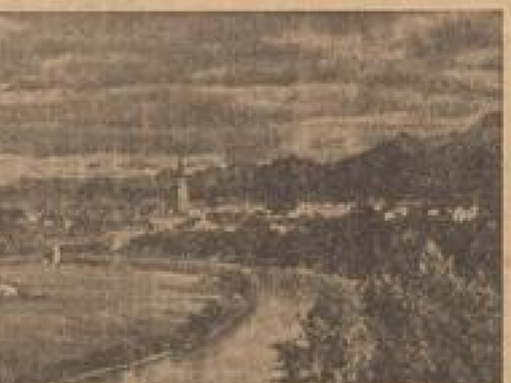
Blick auf den Karawanken