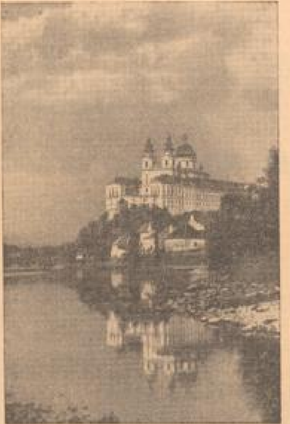
Wachau Niederösterreich: St. Melk a. d. Donau