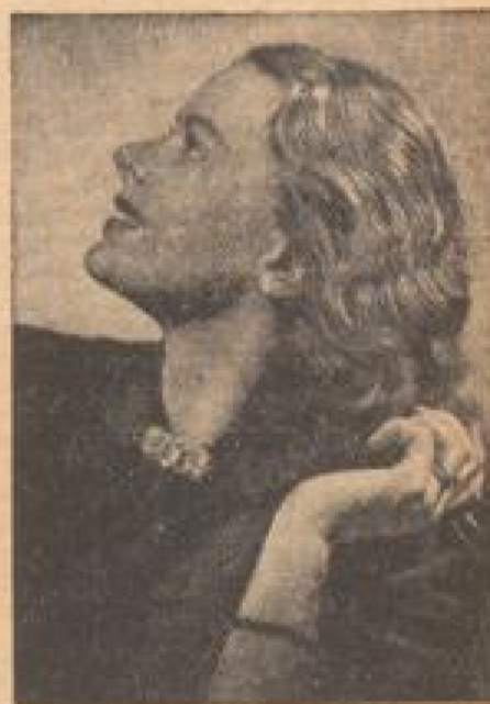
Ingrid Bergman, die berühmte schwedische Darstellerin, spielt unter der Regie von Carl Froelich im Ufa-Film „Die vier Gesellen“