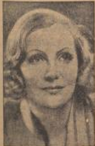
Die „göttliche Garbo“

Diese Aufstellung ist über ausfallsreich: man weiß nicht, ob es ihr den Geschmack des Films (Übertragung auf Seite 1 der Sonntagsbeilage)