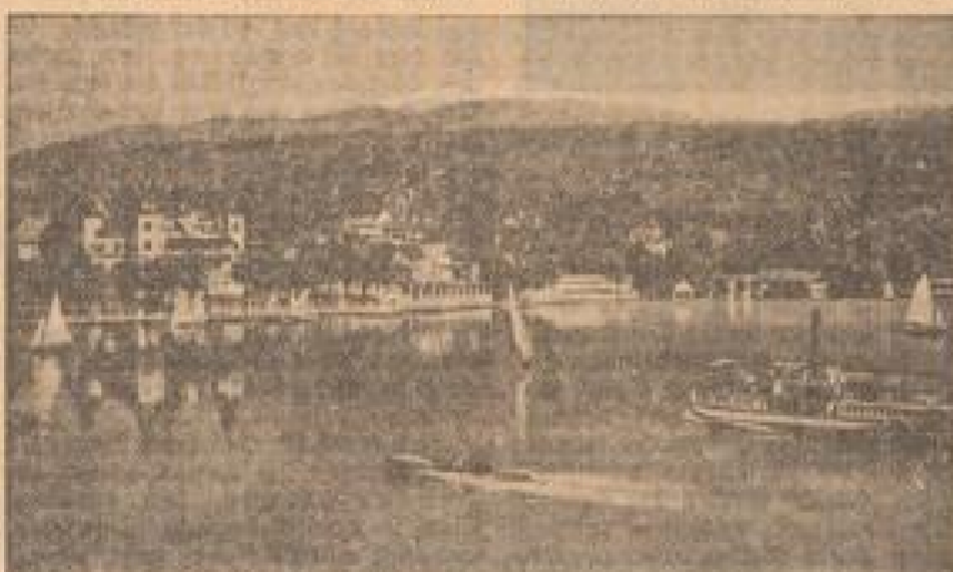
Kurort Sellen am Wörther See in Kärnten