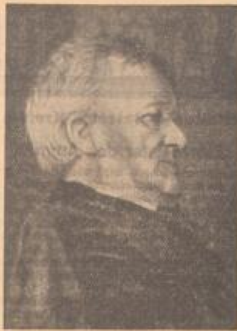
Richard Wagner Die letzte Aufnahme von dem großen Komponisten.