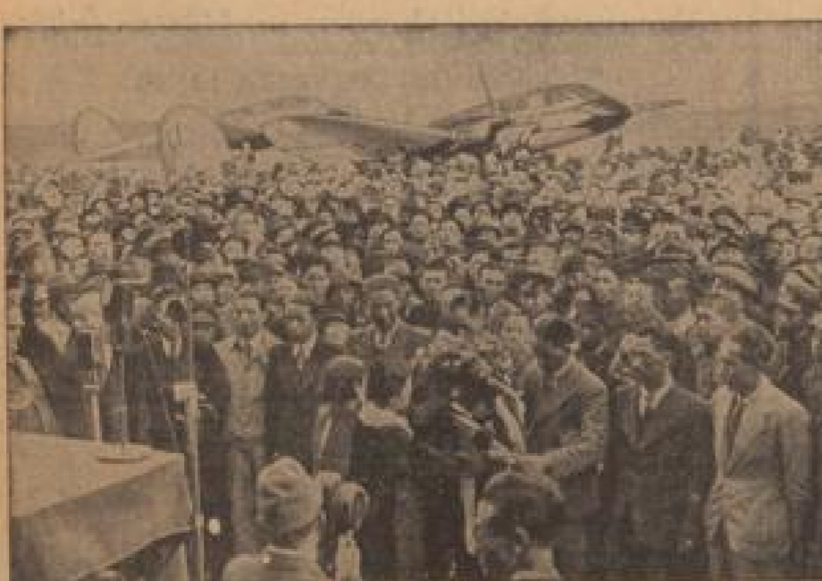
Von Berlin nach Tokio in 54 Stunden

Das Goldene Rad von Mannheim ist ein wichtiges Denkmal für die deutsche Sportwelt. Es erinnert an die großen Leistungen der deutschen Sportler und ist ein Symbol für den deutschen Sport.