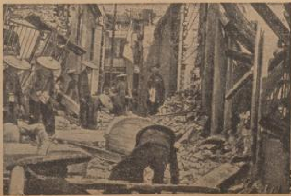
Die tschechische Wollwarenfabrik in Eger wurde am 21. Mai durch einen Bombenanschlag zerstört. Ein Teil der Fabrik wurde zerstört und dem Vandalismus preisgegeben.