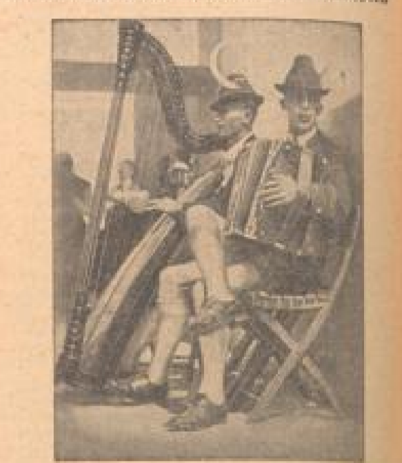
Zwei Dorfmusikanten aus dem Unterwald in der Pfalz...