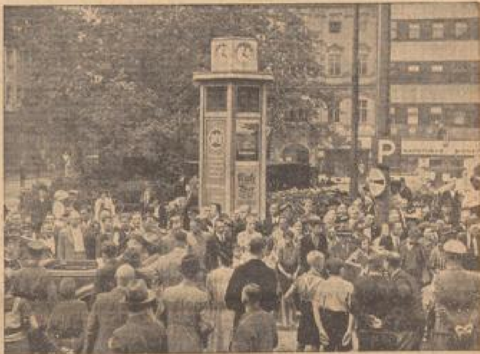
In Koblenz erfolgte die Inbetriebnahme der ersten hundert Laufsporecher-Säulen...

Der Tag in der „Times“, daß man entgegen sei hierüber, ist so auffallend, daß in ihm eine Kritik an der Haltung der Regierung getroffen werden muß.