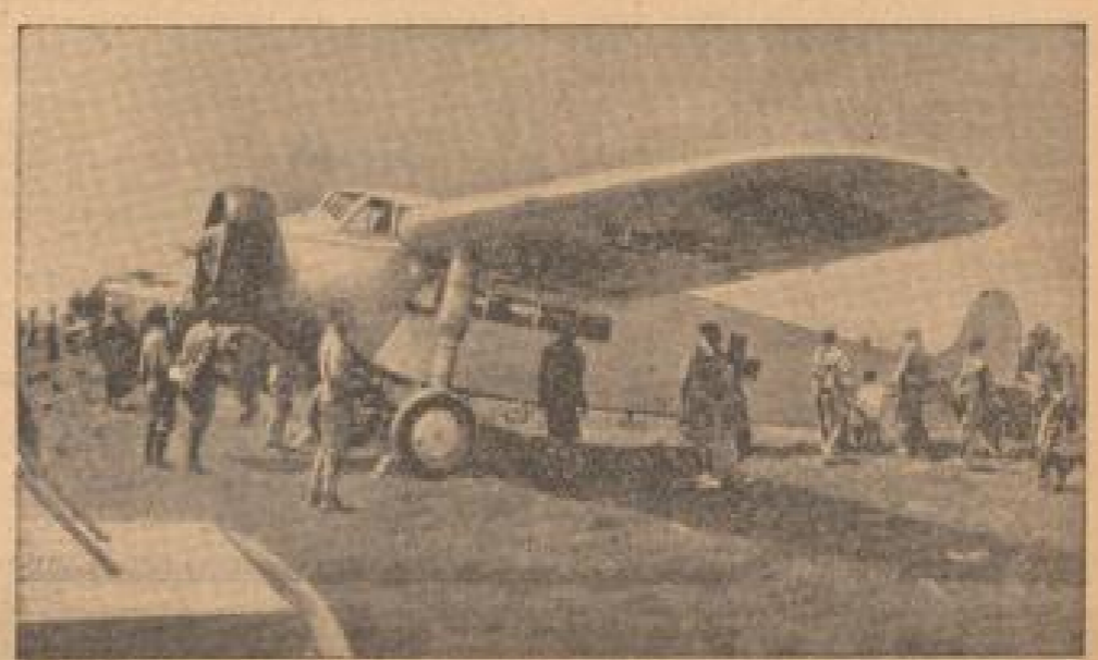
Die viermotorige Maschine von acht Zylinder, die von der kanadischen Flugzeugindustrie des Herstellers Martin-Baker entwickelt wurde. Die erste Maschine auf diesem Bild ist eine kanadische Maschine, die zum ersten Mal von der kanadischen Luftwaffe verwendet wurde. (Freiburger, Röhler-M.)

Eröffnung des Rundfunksenders von Addis Abeba. Der neue Rundfunksender Addis Abeba wird heute zum erstenmal mit dem italienischen Rundfunk verbunden und für alle italienischen Sender ein gemeinsames Sendeprogramm senden.