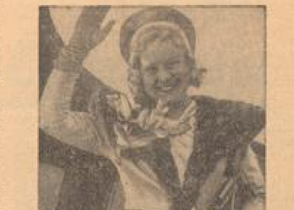
Ob „Gästel“ nach Berlin kommt? Die letzte Nacht in der Hauptstadt von Frankreich. Die letzte Nacht in der Hauptstadt von Frankreich. Die letzte Nacht in der Hauptstadt von Frankreich.