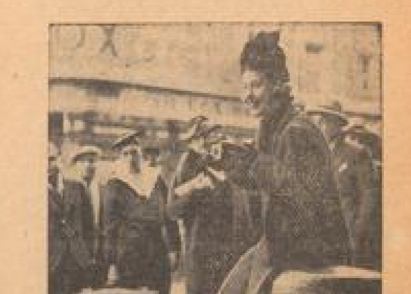
Bitte, recht freundlich! Die beliebte amerikanische Filmstar Claudette Colbert. Die beliebte amerikanische Filmstar Claudette Colbert.

Die Zeppelin-Ritter sind eine Gruppe von Männern, die in der Stadt herumlaufen. Die Zeppelin-Ritter sind eine Gruppe von Männern, die in der Stadt herumlaufen. Die Zeppelin-Ritter sind eine Gruppe von Männern, die in der Stadt herumlaufen.