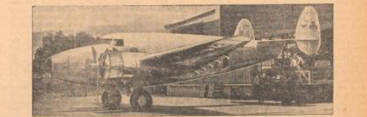
Aut der Jagd nach dem Weltrekord Mit dieser unerschrockenen Lockheed-Motorkraft mit der jungen amerikanischen Fliegerin Douglas MacArthur hat sich der neue Weltrekord für die Jagd nach dem Weltrekord.