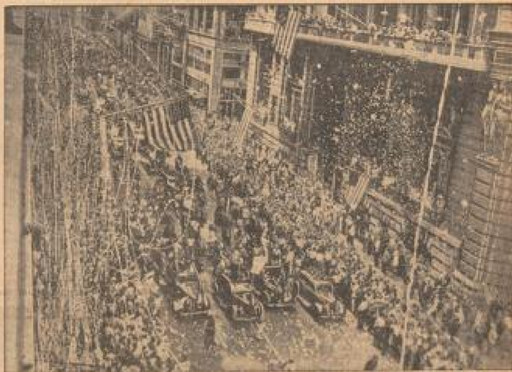
Der „Toll Eulenpiegel“ der Lüste in Reungorf empfangen

Der Herzog und die Herzogin von Gloucester vergnügen sich hier auf der großen Ausstellung des Automobilverkehrs in London.