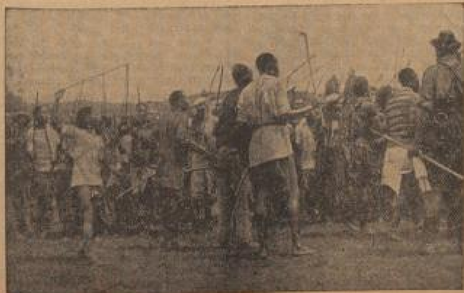
Mit viel Geschrei

Der Panafrikanismus ist in ganz Afrika auf dem Vormarsch, Rußland arbeitet auch hier an der Unterminierung der bestehenden Verhältnisse zwischen Schwarz und Weiß. Daher ist es doppelt anzuerkennen, daß Südafrika alles daransetzt, seine Schwarzen vor weiterer sozialistischer Einflüsse zu bewahren. Walter Gieseler