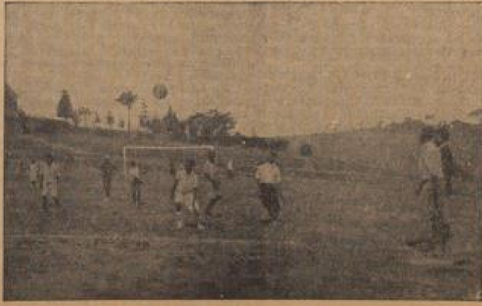
Fußball ist der Lieblingsport der Farbigen

erlangen schwarze Minenarbeiter, die von marxistischen Agitatoren aufgebracht worden sind, höheren Stundenlohn