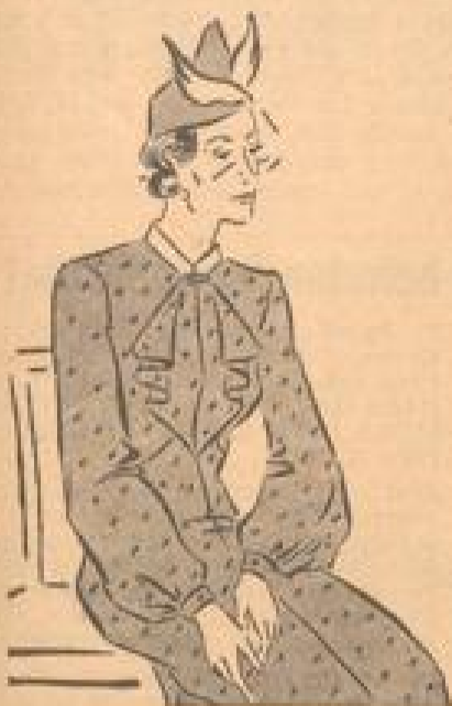
Verantwortlich für diese Beilagen: Maxime Schöberl, Mannheim.

Unsere Leistung hat sich durchgesetzt! Überzeugen auch Sie sich von unserer Auswahl, Preiswürdigkeit u. unserem Geschmack!