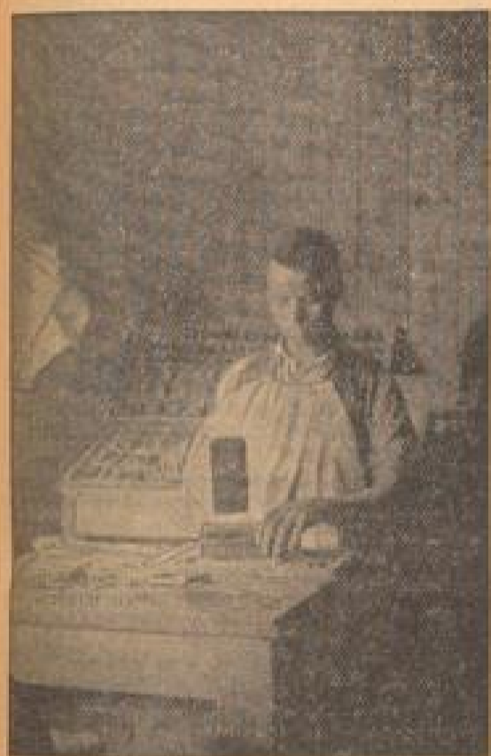
Schwarzer Jünger der schwarzen Kunst: In eigener Druckerlei lesen die Schwarzen ihre von Schwarzen geschriebenen Zeitungen

Großbritanniens Sorge um „Black and White“ — Südafrika greift das Rasseproblem auf — Moskau will im Trüben fischen