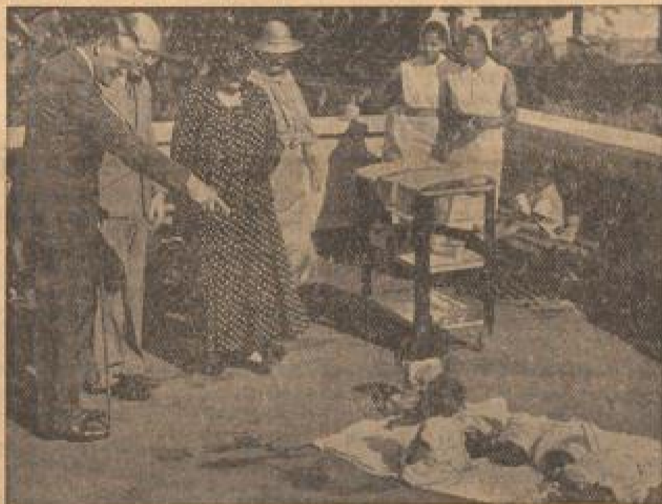
Vor seiner Majestät sind alle gleich:

Kunzblicklich beschäftigt sich die Regierung der Union von Südafrika mit der Rassenfrage; es handelt sich darum, ob Schwarz und Weiß in der Union nebeneinander bestehen können und unter welchen Bedingungen. Genau wie in den Vereinigten Staaten von Amerika, wo nach Einverleibung der Südstaaten die „Rassenfrage“ ein ungelöstes Problem geblieben ist, steht heute die „Rassenfrage“ in der Südafrikanischen Union an erster Stelle. Die Berührung mit dem Europäer in Südafrika hat auffälligerweise zu einer riesigen Bevölkerungszunahme geführt. So verdoppelte sich die Zahl der Schwarzen in der Kapprovinz in weniger als dreißig Jahren und im angrenzenden Betsutoland in weniger als zwanzig, begünstigt durch das Kriegsverbot unter den einzelnen Stämmen untereinander sowie durch das beschränkte Alkoholverbot, und durch das schnelle Vordringen europäischer Gesundheitsmaßnahmen, die heute schon bis in den tieflegendsten Areal bringen.