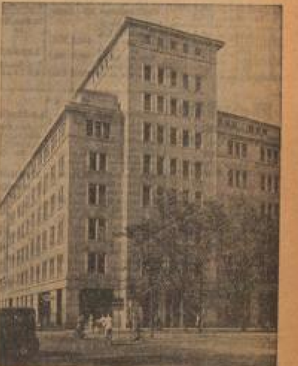
Das repräsentative Gebäude in Gumburg