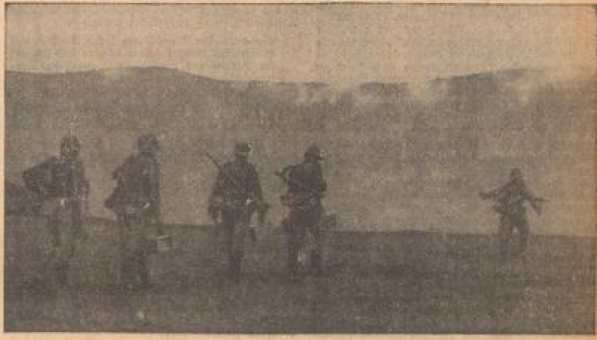
Eine der letzten Kolumnen bei der Besetzung von Sudetendeutschland hatten die Truppen im Rücken. Die Soldaten sind im Hintergrund zu sehen. Die Soldaten sind im Hintergrund zu sehen. Die Soldaten sind im Hintergrund zu sehen.

Der Besatzungsleiter für den vierjährigen Plan, Generalmarschall Göring, hat über die Einführung der Reichsmarktwährung in den Sudetendeutschen Gebieten am 10. Oktober folgende Verordnung erlassen: § 1. Gesetzliches Zahlungsmittel in den Sudetendeutschen Gebieten ist neben der tschechoslowakischen Krone die Reichsmark. Eine tschechoslowakische Krone ist gleich 12 Reichspfennig. § 2. Der Reichswirtschaftskommissar erläßt die zur Ergänzung und Durchführung dieser Verordnung erforderlichen Vorschriften. § 3. Diese Verordnung tritt am 11. Oktober 1938 in Kraft. Der Umrechnungskurs ist abweichend von Deutschland, der rund 67 Pfennig für die Krone beträgt, auf 12 Pfennig für die Krone festgelegt worden. In der Absicht, die Sudetendeutsche Wirtschaft auf einer gesunden Grundlage in das Reich zu integrieren. Durch das gewählte Umrechnungsverhältnis sollen Preissteigerungen in den Sudetendeutschen Gebieten vermieden werden.