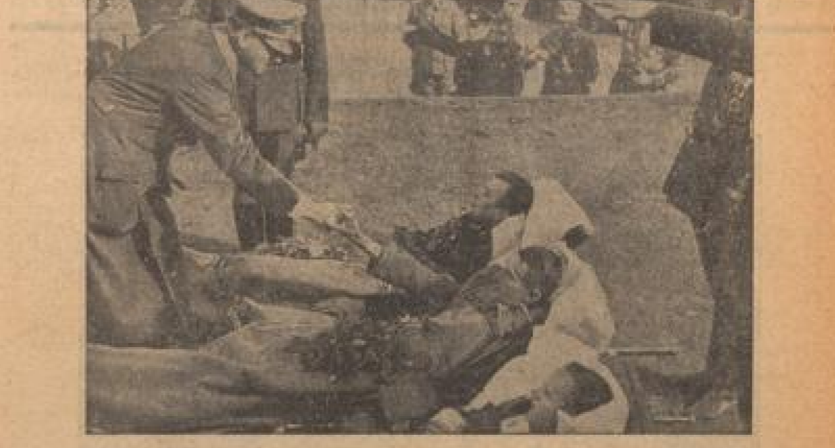
Der Führer besucht in der tschechischen Stadt Reichenberg Sudetendeutsche Volksgenossen und deutsche Grenzwehler, die im Kampf gegen die tschechischen Besatzer verlegt wurden.