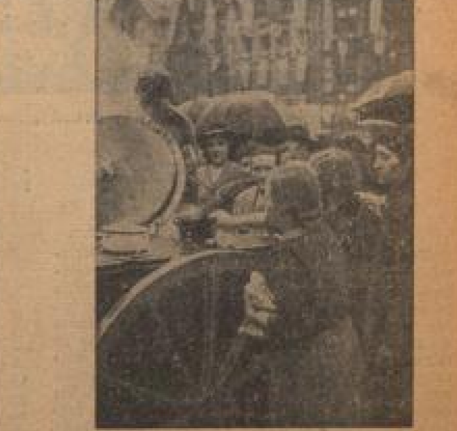
Hilfskräfte und NSD-Mitglieder am Sonntag der Besetzung in den Gebieten Sudetendeutsches Gebiet. Man erkennt den tschechischen Grenzwehler im Bild bei der Ausgabe des tschechischen auf dem Reich-Grenzgebiet in Reichenberg.