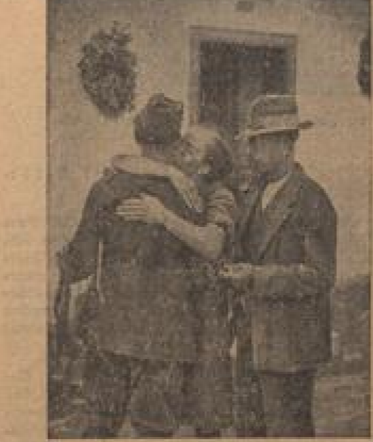
Ein begeistertes Bild von der Heimkehr der jungen Sudetendeutschen, die aus dem tschechischen Hinterland zurückgekehrt sind. Unter Führung des Führers sind sie im Bild zu sehen. Die Soldaten sind im Hintergrund zu sehen.

England jemals Deutschland wie ein Baby behandelt, das eine englische Armee nötig hätte? und wann hätte sich England je in innerdeutsche Angelegenheiten gemischt? Die Blätter weisen hin im übrigen offen, daß in Großbritannien deutsche Erfahrungen sind und man sich auf Grund längerer (schlechter) Erfahrungen mit außenpolitischem Ungegenkommen zurückzieht. „Eine ausgesprochen friedliche Haltung“ (ab. Paris, 11. Oktober) Mit der Rede des Führers befaßt sich der recht einseitige oppositionelle „Dziennik Narodowy“ am Dienstag ausführlich. Er schreibt, die Rede Adolf Hitlers in Saarbrücken werde, ungeachtet dessen, was verschiedene französische und englische Blätter schreiben, von einer ausgesprochen friedlichen Haltung gekennzeichnet. Starke Wendungen seien meistens an die Adressen der Staaten und ihre amtliche Politik gerichtet, als an die Adressen der internationalen Logen, das eine kriegerische Ideologie vertrete und die europäische Politik den eigenen Zielen gewalttätig anpassen wolle.