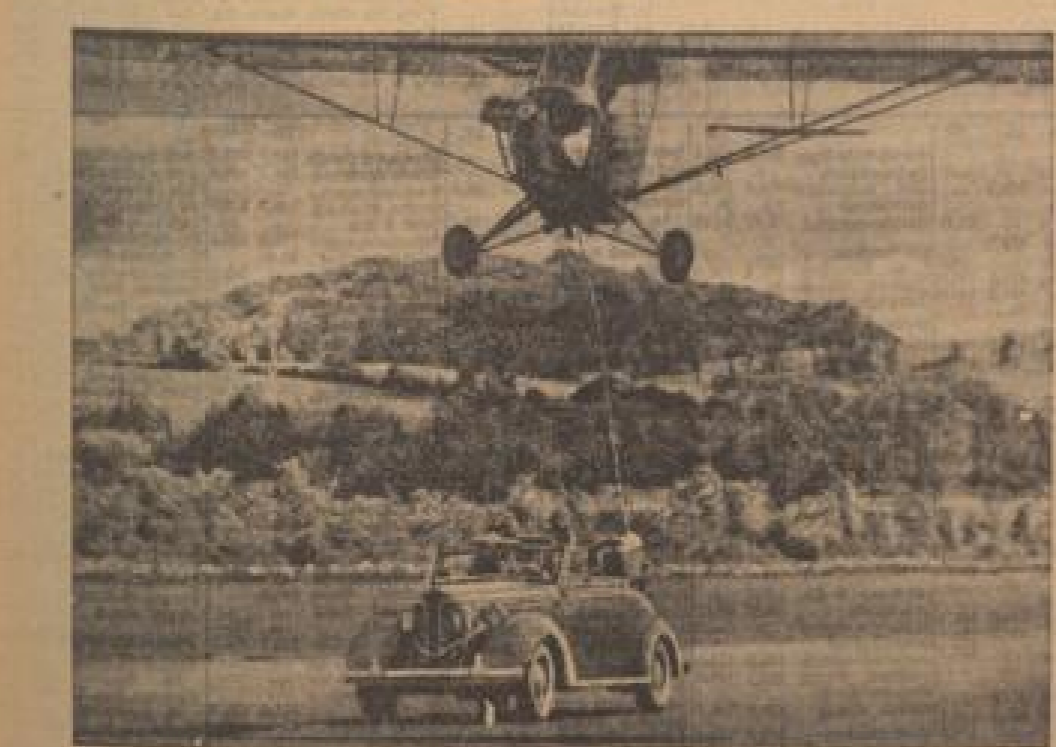
Langstreckenflieger versorgen sich mit Nahrungsmitteln

Die 17 mal gewonnenen Spiele sind ein Beweis für die Leistungsfähigkeit der Spieler. Es ist notwendig, Maßnahmen zu ergreifen, um die Leistungsfähigkeit der Spieler zu verbessern.