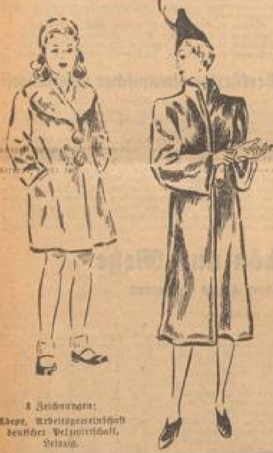
3. Gehmänder: Mäntel, Paletots, Capes, Besätze, Besätze, Besätze, Besätze.

Ein sehr sachlicher Brief an die liebe Freundin