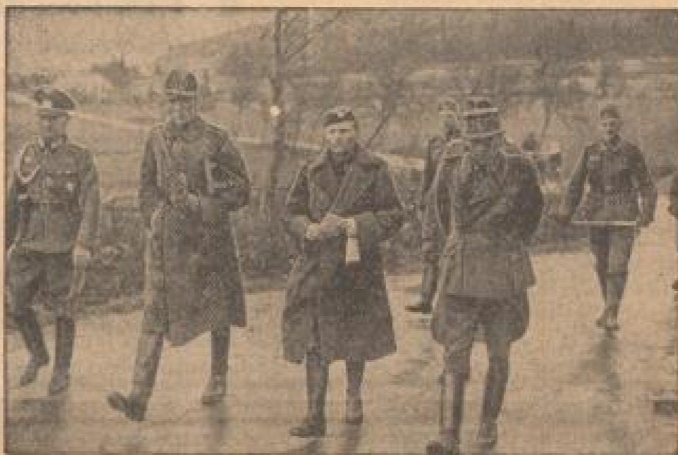
Neu aufbereitete Wunderrichter, die die deutschen Truppen bei ihrem Marsch in die letzten zu besetzenden Bezirke in Südkina begleiten, erhalten mit besonderer Aufmerksamkeit die höchsten Offiziere über die Ausbreitung der japanischen Truppen.