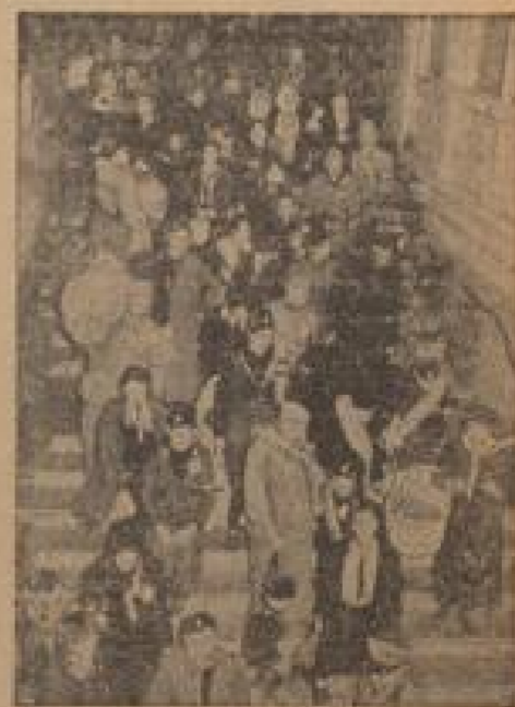
Italienische Soldaten auf dem Wege nach Ägypten Die italienischen Soldaten und ihre Familien auf dem Wege zum Osten in Rom. (Weiß, Sonder-Multiplex)