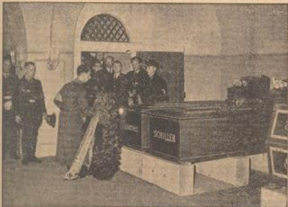
Die Eröffnung der Deutschen Buchwoche Die Art. Bucherstadt zu Weimar über Reichsminister Dr. Heß 1934 die großen deutschen Bücher-Wand- und Zeilert durch eine Kranzniederlegung an ihren Gedenktagen. (Weiß, Sonder-M.)