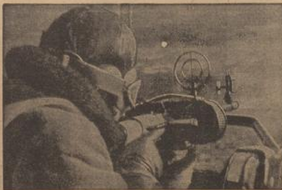
Unsere Wehrmacht — unser Wille Im Tiefengriff lenkt der 100.000te eines Panzertruppen mit Geschützmontagen auf den Weg. (Ebert-Bildschirm, Sonder-Multiplex)