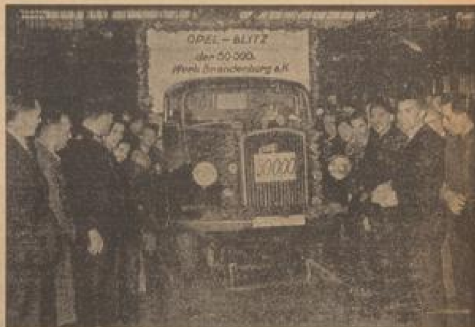
Im Brandenburg verließ der 30.000. Opel-Blitz-Fahrer den Montagabend, am 7. Januar 1934 wurde die Produktion aufgenommen, jedes Minute liefert der 30.000. „Blitz“ vom Band, nach weiteren 1000 Minuten der 30.000. und 1934 der 30.000. (Weiß-Gottmann, Sonder-Multiplex)