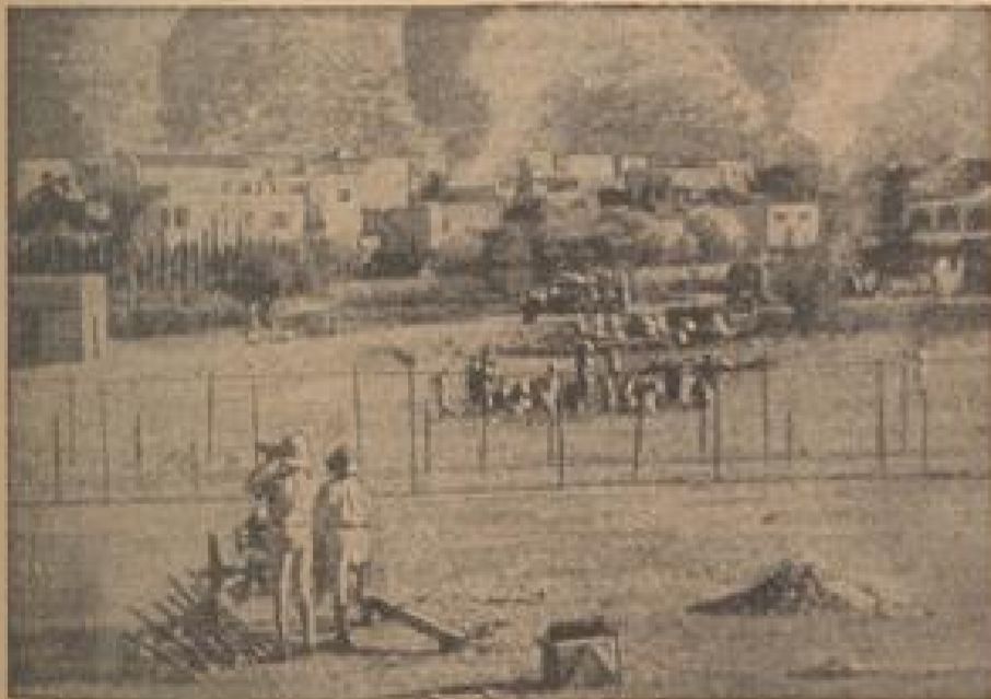
Die der Kolonial-Offiziere südlich von Galla wurde ein Lager für politische Gefangene von den Engländern errichtet.