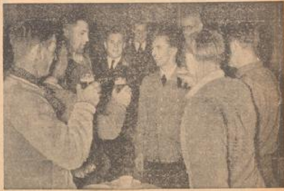
Der 41. Geburtstag Dr. Goebbels Gastgeber, die am Erweiterungsbau des Propagandaministeriums beschäftigt sind, proben dem Minister mit der „Geburtsloggelle“ zu. (Ebert-Bildschirm, Sonder-Multiplex)