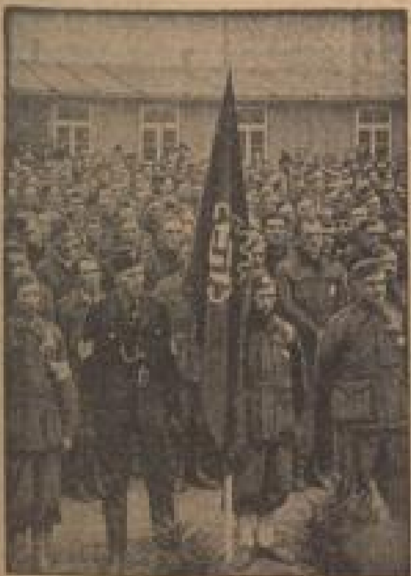
Am Jahrestag der „Macht auf Rom“, am 28. Oktober, haben die in Deutschland lebenden italienischen Arbeiter zu einer Parade an ihren Arbeitsstätten zusammen. Die Feste im Gewerkschafts-Haus in München bei Kapte. (Weiß-Gottmann, Sonder-Multiplex)