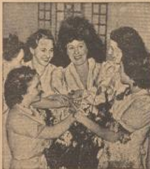
Heute Widinette — morgen Filmschauspielerin Diese Gruppe machte ihre letzte Widinette, welche von der Filmproduktionsfirma Grace Moore in den Berliner Studios aufgenommen wurden, um mit ihr in dem neuen Film „Lustige“ zu spielen. — Grace Moore (Mitte) mit dem fünf Widinette.