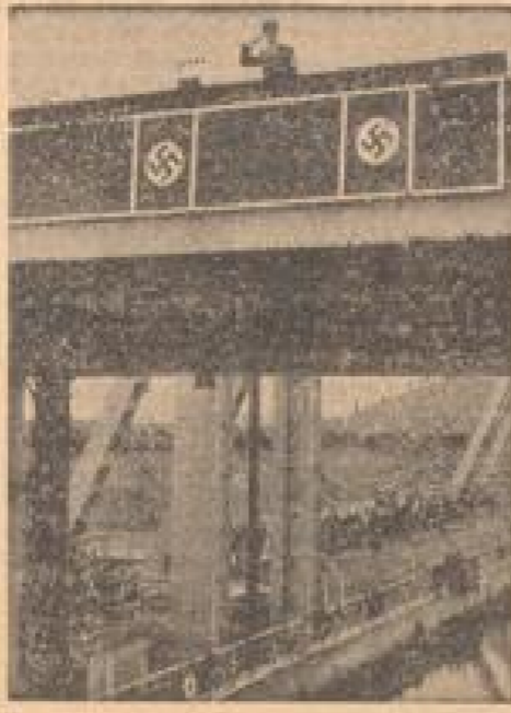
Die feierliche Hebergabe durch Reichsminister Rudolf Heß (Weiß, Sonder-Multiplex)