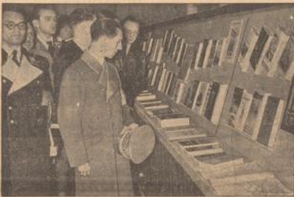
Im Rahmen der Reichsberufswettkampfes erwidert Reichsbücherei Dr. Reichsberufswettkampfes in der Bibliothek des Niemellandes.

In dem niemelländischen Dorf erfolgte ein Zwischenfall. In dem Niemelländer erwiderten dem Reich die Niemelländer erwiderten dem Reich die Niemelländer erwiderten dem Reich die Niemelländer erwiderten dem Reich die Niemelländer erwiderten dem Reich die Niemelländer erwiderten dem Reich die Niemelländer erwiderten dem Reich die Niemelländer erwiderten dem Reich die Niemelländer erwiderten dem Reich die