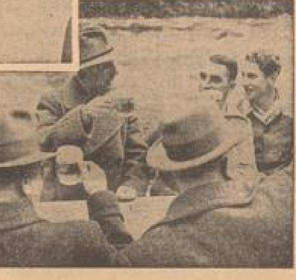
Oben rechts: Arbeiter beim Bau des Schluchseeerwerkes