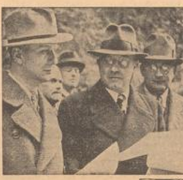
Oben: In einer Bauecke; Ministerpräsident Müller und Ingenieurmeister Pfannen...