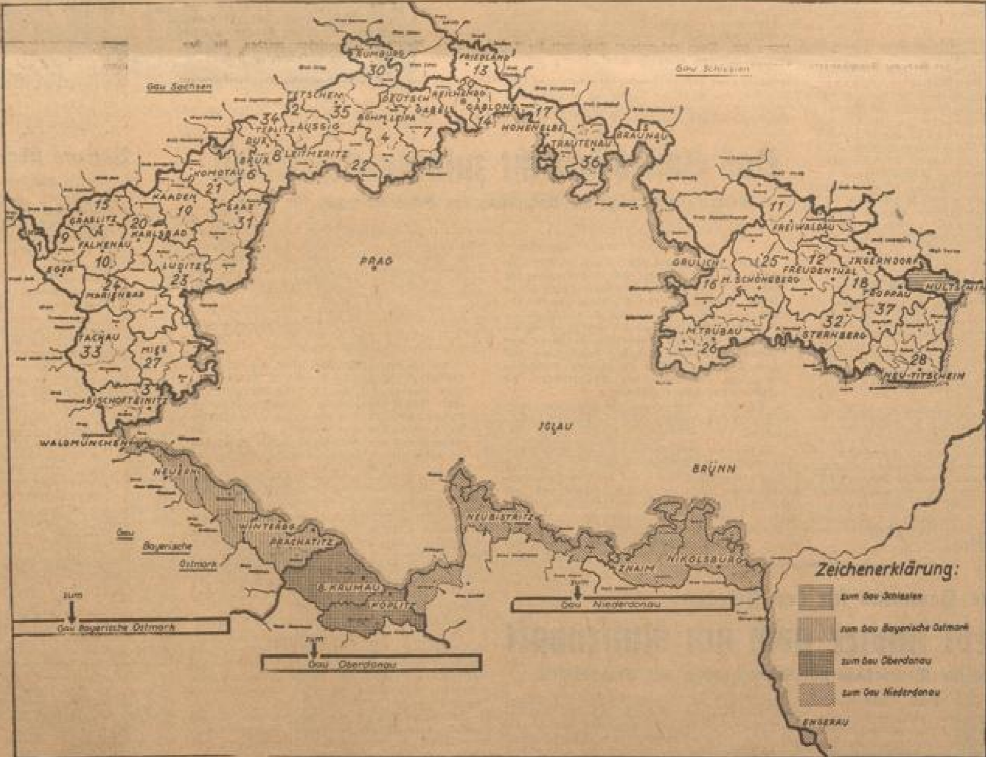
Den anderen Gaue werden außerdem die aus der Karte ersichtlichen Bezirke bzw. Reichbezirke zugewiesen.

Am Berlin, 21. Oktober. Der Führer hat folgende Verfügung erlassen: Ich verlege, daß mit dem heutigen Tage die sudetenländischen Bezirke nördlich der Furthberg Grenze bis zu den Bezirken Kruppa-Kamitzsch ein- schließlich den Gau Sudetenland der NSDAP bilden. Als Sitz der Gauleitung bestimme ich die Stadt Reichendorf. Zum Gauleiter des Gau Sudetenland der NSDAP ernenne ich den Vg. Konrad Denlein, zum stellvertretenden Gauleiter den Vg. Karl Hermann Frank. Gauleiter Denlein hat umgehend nach den Weisungen meines Stellvertreters die Überleitung der NSDAP, ihrer Gliederungen und angeschlossenen Verbände in die Wege zu leiten. Die entsprechenden Maßnahmen in den an die