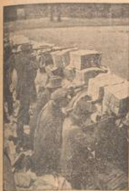
Dokumente aus Deutschlands traurigsten Tagen Spartakisten hinter Barrikaden im Berliner Zeitungsviertel.

Zum 20. Male jährt sich der Tag der Revolte vom 9. November 1918