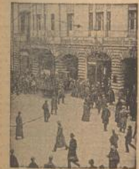
Das Schiffe des „Vorwärts“ in Berlin wird von Spartakusbund besetzt