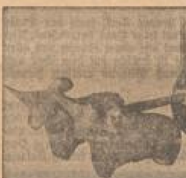
Ein nichtiges Spielzeug. Nach: Ernst Hader, 'Die Industrieländer', Verlag v. H. Brockhaus, Leipzig.

Die kleinen Karren, die man im Punjab machte, gehören das japanische Spielzeug u. d. d. bei Spielen oder Art verwendeten Gegenstände, die sowohl in Mesopotamien als auch in Europa zum Vorkommen kamen.