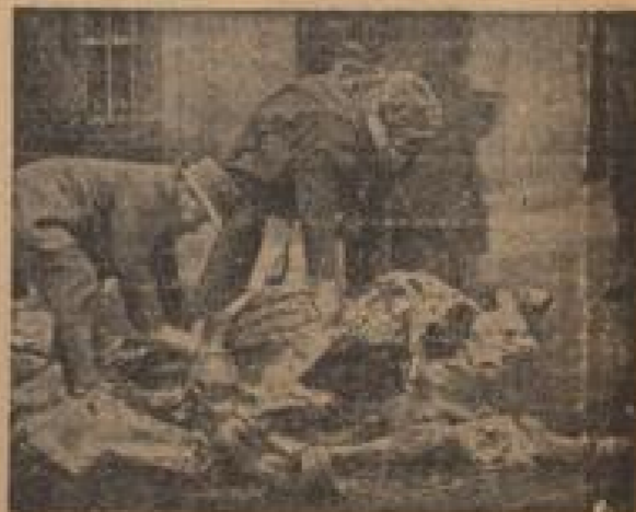
Hungerriots in München Das Volk hungert. Passanten schneiden sich von einem strachosenen Pferd auf der Straße Fleischstücke ab.