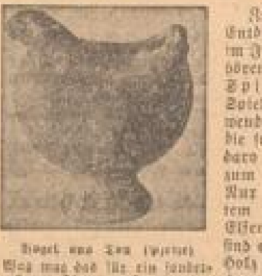
Vogel aus Ton (Japan). Nach: Ernst Hader, 'Die Industrieländer', Verlag v. H. Brockhaus, Leipzig.

In den vorerwähnten Entdeckungen, die man im Punjab machte, gehören das japanische Spielzeug u. d. d. bei Spielen oder Art verwendeten Gegenstände, die sowohl in Mesopotamien als auch in Europa zum Vorkommen kamen.