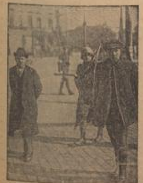
Gefangene Spartakisten werden abgeführt

Ein trüber Novembertag liegt über dem Kriegshalen Wilhelmshaven. Auf dem grauen Wasser der Jade liegen die mächtigen hölzernen Kolosse der unbesiegt deutschen Kriegsflotte. Aber nur äußerlich herrscht Meeresstille ungebrochener Macht und herrlicher Kampfkraft. Rote Wähler sind seit Wochen am Werk, um die Mannschaften gegen ihre Offiziere aufzuwiegeln. Dazu kommt, daß das trübselige Gerücht verbreitet wird, der Kaiser wolle, wo Scheiter alles zu Ende geht, die Flotte opfern. Es sei vorgezogen, in einem Angriff gegen England die ganzen Streitkräfte mit ihren Besatzungen vernichten zu lassen. Die biedersten Wehrmänner rufen Roten und schenken den Propaganda nur allzu willig Glauben. Es kommt zum roten Aufstand auf