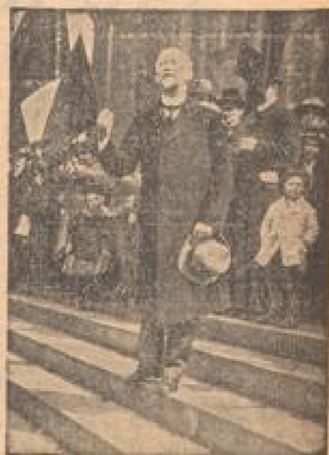
Philipp Scheidemann, einer der roten Unterministeren, spricht von den Stufen des Reichstags zur Menge.

Es herrscht auch ein roter Brandstiftung zwischen der Bolschewiki und Moskau. Mit Kartengeld heben die Transporte selbstverständlich außer Kontrolle der Behörden. Das ging so lange, bis einige Bewährte eine dieser Rufen „versteckentlich“ in den Fahrkartenschicht fallen lassen. Sie geht in Trümmer und eine Flut von bolschewistischem Propagandamaterial, das unter dem Schutz der Exterritorialität der Bolschewiki verbreitet werden soll, ergießt sich auf den Feindboden. Der Gemeindegewalt Tötung war erlaubt. Der jüdische Bolschewiki Jaffe war mit dem gesamten Personal der