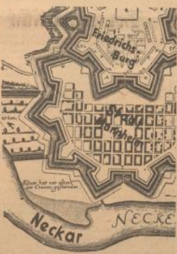
Die inmannebräunlichen Festungsreste der Stadt Mannheim nach dem 2. Teilchen Plan von 1688.