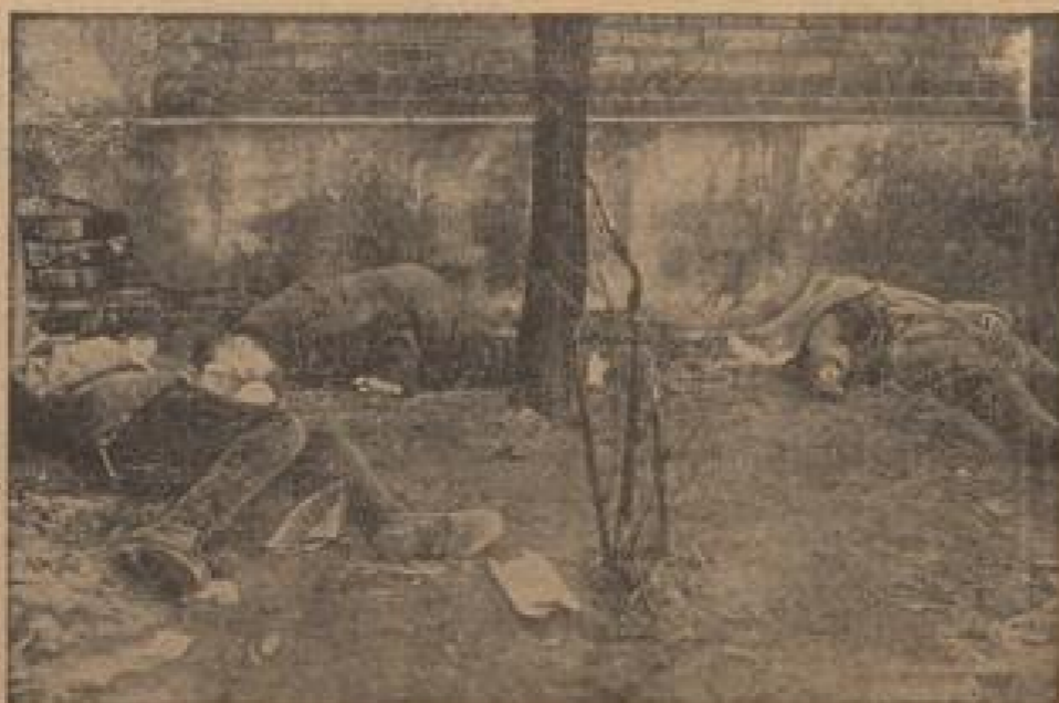
Hungerriots in dem Berliner Bezirk Liebenberg