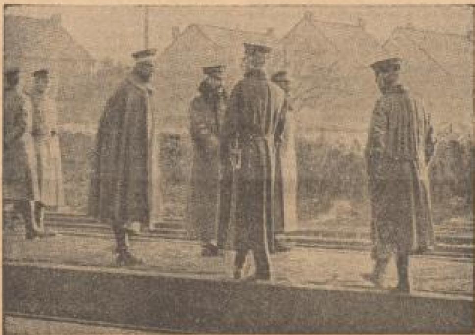
Kaiser Wilhelm II. überschreitet an der Grenzstation Rijssen die holländische Grenze Obwohl sich der Kaiser weigerte, dem ihm von dem neugebildeten Kabinett unter Prinz Max von Baden und Scheidemann gestellten Ultimatum auf Abdankung Folge zu leisten, sah er sich doch am 9. November 1918 unter dem Druck der blutigen Unruhen in verschiedenen Städten genötigt, den deutschen Boden zu verlassen.

Bereits seit Wochen hatte sich die russische Bolschewiki in ihrem Palais Unter den Linden zu einem Inspektionsherd für das bolschewistische Gift entwickelt, das nach dem Friedensschluß von Brechtenskiw letztendlich in Europa hineingetragen