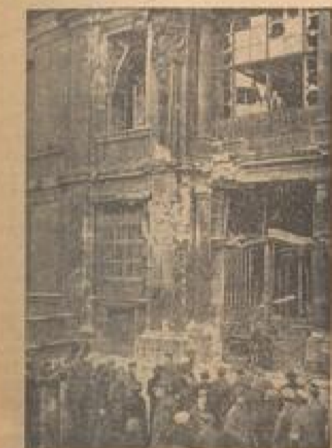
In schwerbeschädigte ehemalige Kaiserliche Schloß und des Berliner Straßenkämpfen mit der Kommune