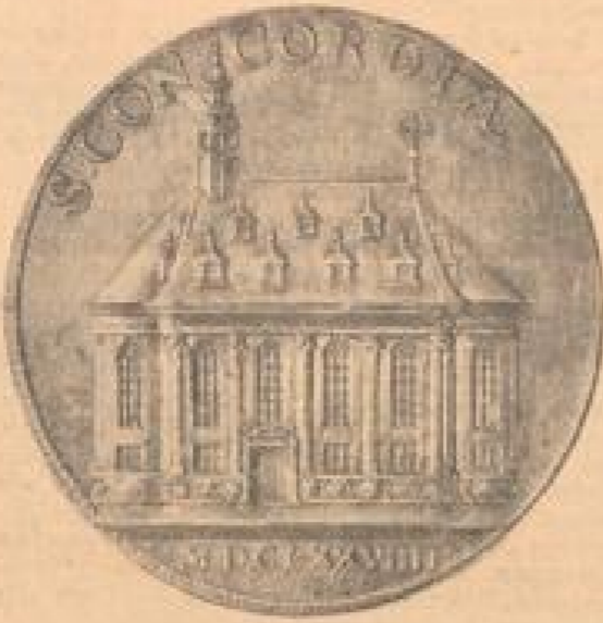
Silbermedaille mit der 1870 in der Festung Friedrichsburg erhaltenen Gedenkmedaille, die Kaiser Karl Ludwig zur Erinnerung seiner Anwesenheit in Mannheim erhaltenen Gedenkmedaille im Besitz des Reichsmuseums.

Die Übergabe der Festung an die Franzosen im Orléansischen Krieg