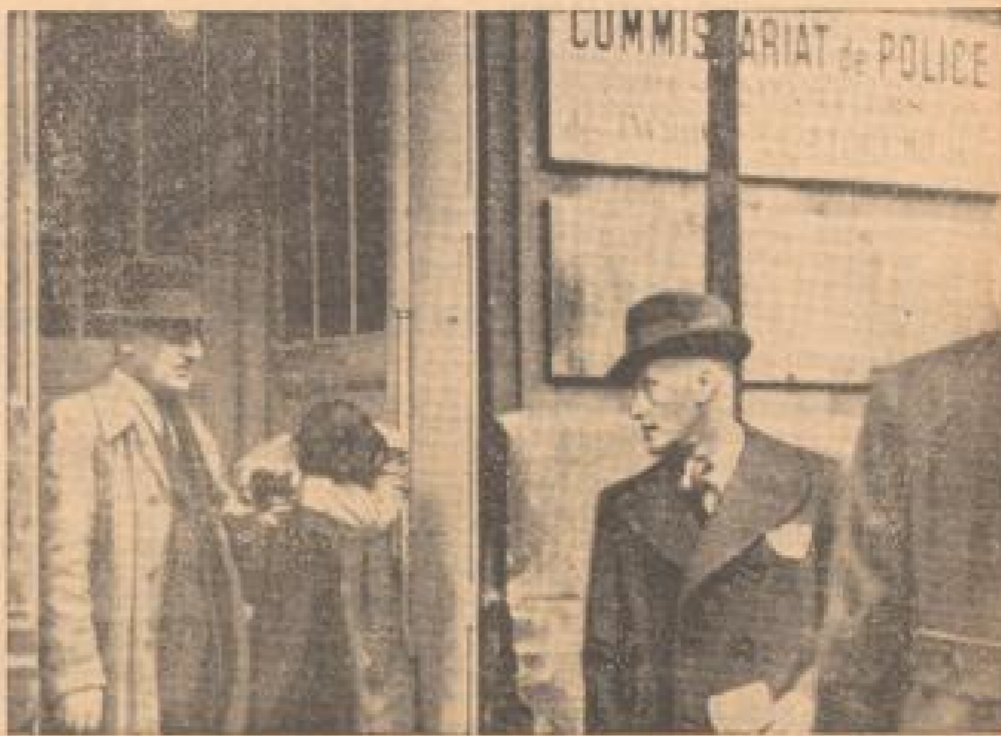
Der Attentäter vor seiner Vernehmung in der Pariser Volkspolizei.

Das Befinden des Verletzten immer noch sehr ernst