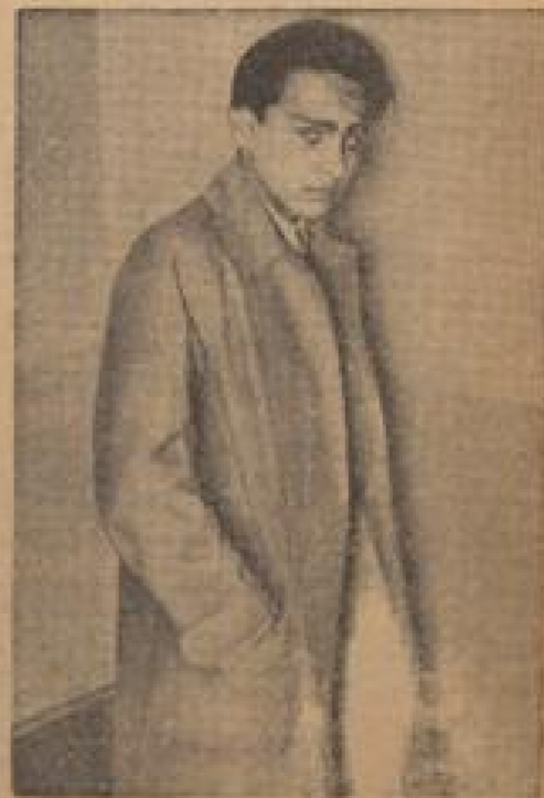
Abel Eberle, französischer Abgeordneter.