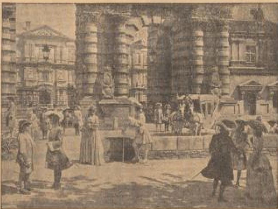
Paris — ganz so wie es Ludwig XIV. sah und wie wir es im Ufa-Film „Nanon“ sehen werden