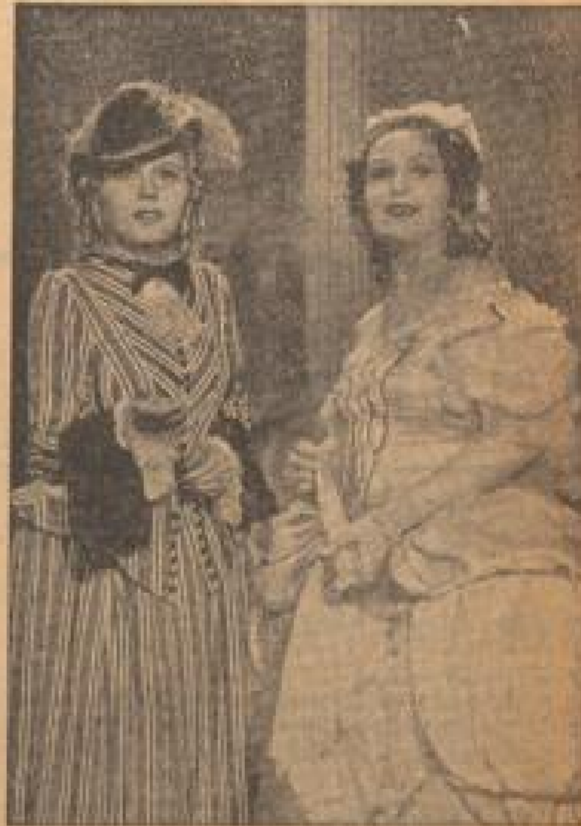
Zwei Rivalinnen hoheln ...