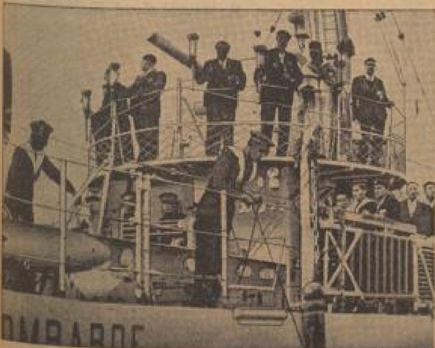
Flammenfeier zum Heldengedächtnis Hundert über die geliebten Helden: Die Zeit zu Zeit treffen Amerikaner auf den Feind und lassen Gedenken ein, um mit den Flammen ihrer mitgehenden Reden das Gedenken an „Abend der Heldentaten“ zu erneuern. (Reynolds & Reynolds, Sonder-Dr.)