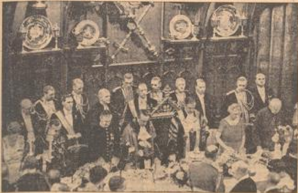
Chamberlain bei dem Galadiner für den neuen Londoner Bürgermeister In der Bildmitte sind die traditionellen Einbürgerungsfeiern für den neuen Lordmayor von London zu sehen, an welchem auch Neville Chamberlain teilnahm.