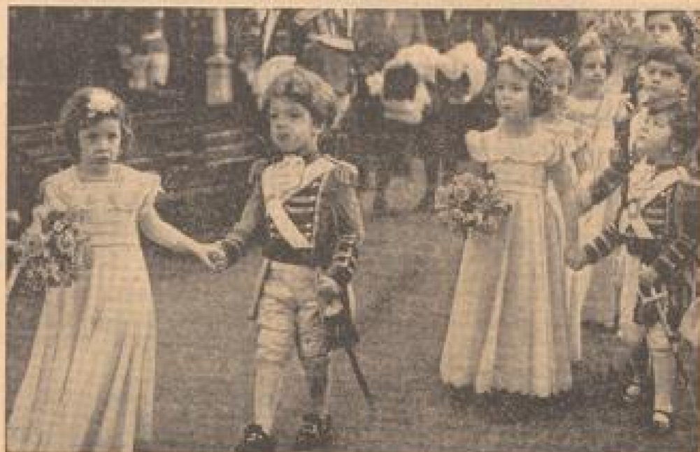
Kleine Leute — sehr wichtig Diese entscheidende Wahl wurde während einer Parade in London aufgenommen.