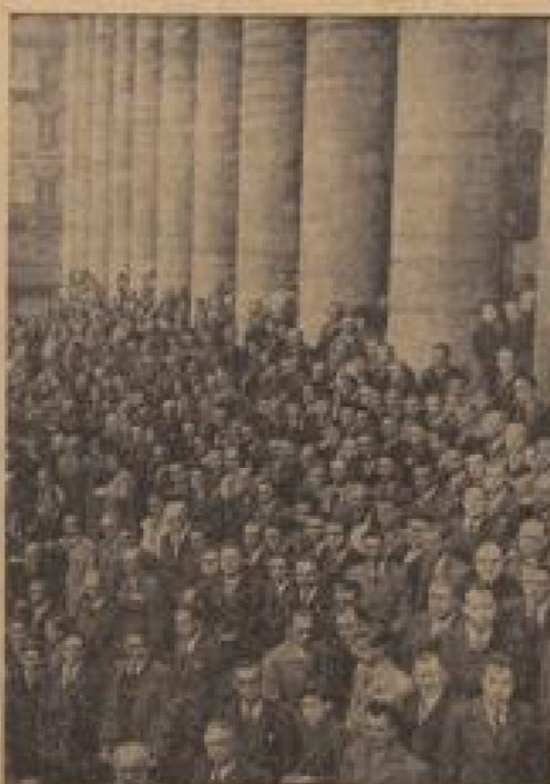
Gedenkfeier für die Toten des Weltkrieges Zum 20. Male führt die Tag der Weltkrieges. Hier sieht man die Soldaten und Weiber der Väter über während der Gedenkfeier.