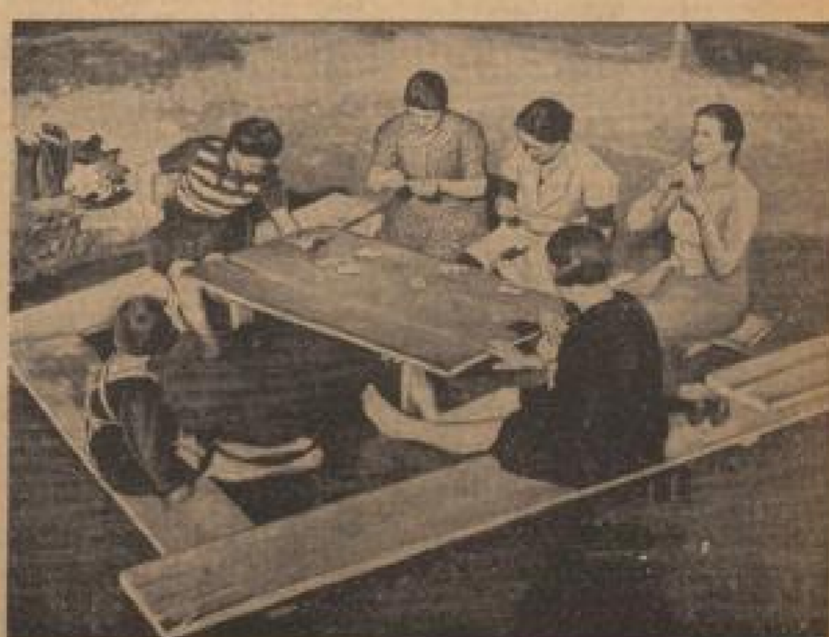
Fußbad beim Kartenspielen Jugend, das nicht, und auch im überirdischen Verstand, wie ich, eine laufende Zeitung von Wasser und Dicht in den letzten warmen Tagen genießen. (Reynolds & Reynolds, Sonder-Dr.)