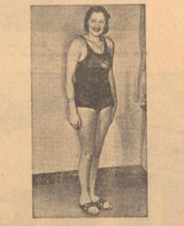
Schwimmlehrerinnen Die bekannte Schwimmschule am Mannheimer Stadion ist von zweierlei Schwimmerinnen besetzt. Die eine Gruppe ist die Mannheimer Schwimmlehrerinnen, die andere die Schwimmschülerinnen. Die Schwimmschule ist von zwei erfahrenen Schwimmlehrerinnen geleitet. Die eine Gruppe ist die Mannheimer Schwimmlehrerinnen, die andere die Schwimmschülerinnen.