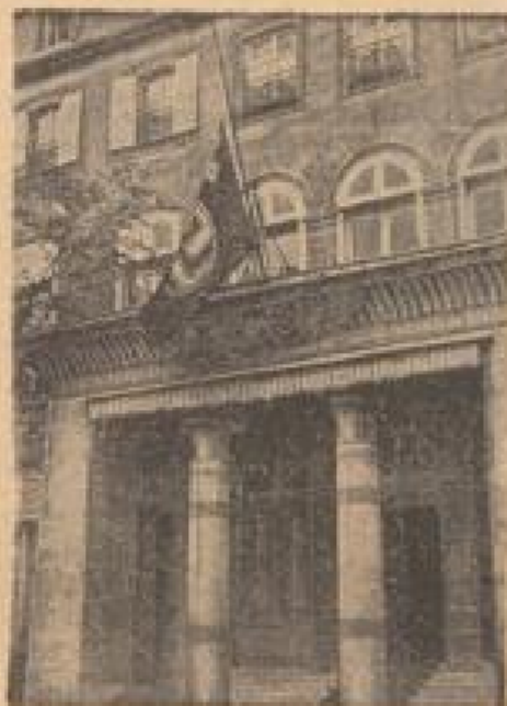
Trauer in der deutschen Botschaft in Paris Die Klänge weht auf Champs-Élysées.