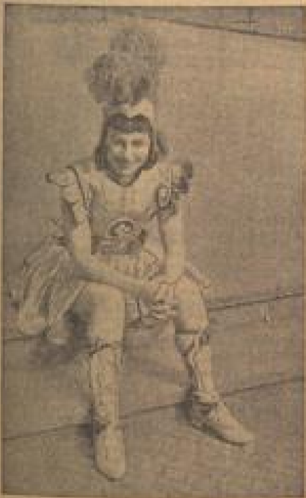
Kleines Fräulein, ganz solo

Im Mittelpunkt der Handlung steht die Blüthe eines Salons, das sich in der Lebenswelt der Hauptrolle Frankreichs besonderer Glanz erhebt. Diese Blüthe ist eben so jung wie schön und befruchtet dazu