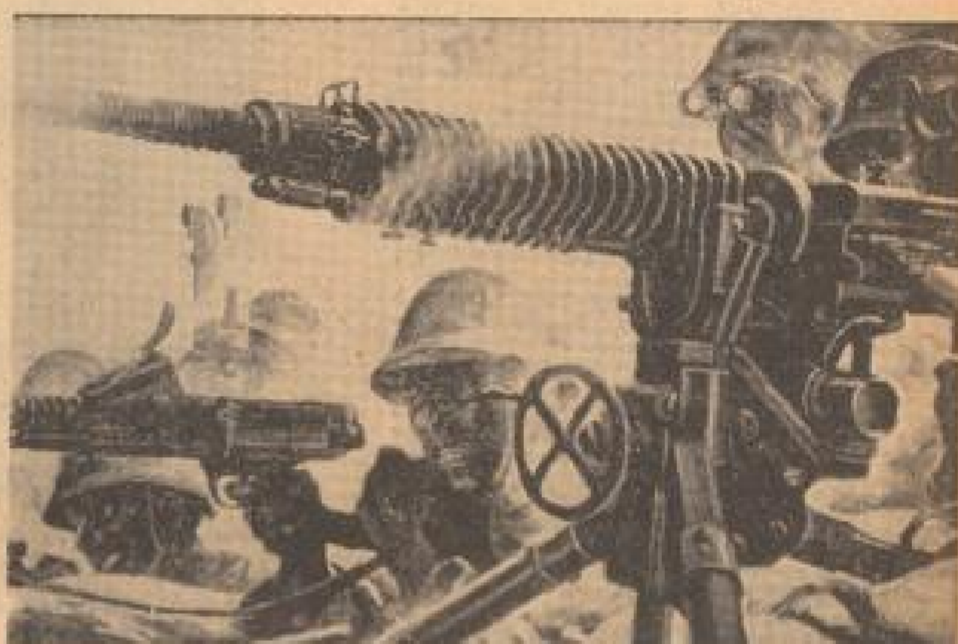
Japanischer Maler malt die „Vorderste Front“ Trotz Hindernisse, in der Kollisions und Komplexion gleich gelungene Bemalte, die „Vorderste Frontlinie“ darstellend, über der berühmte japanische Maler Kawanabe Eitoku.