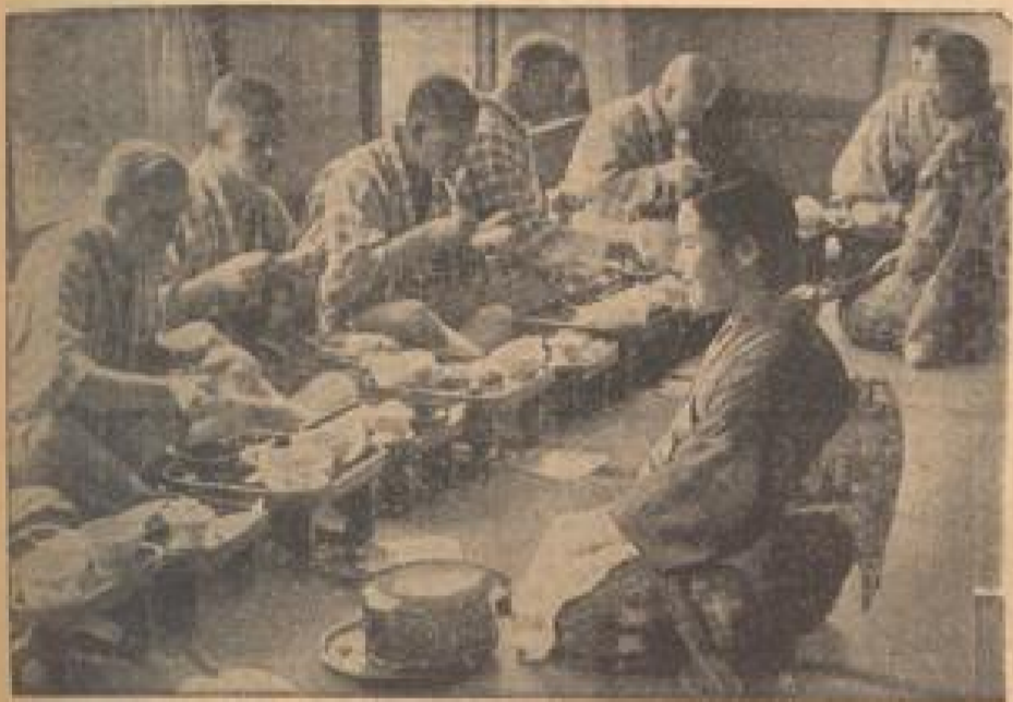
U-Jahre beim Frühstück in Japan Die vier U-Jahre sind in der letzten Zeit ihres Kurantalters bereits mit den Mädchen zusammen. (Reynolds & Reynolds, Sonder-Dr.)