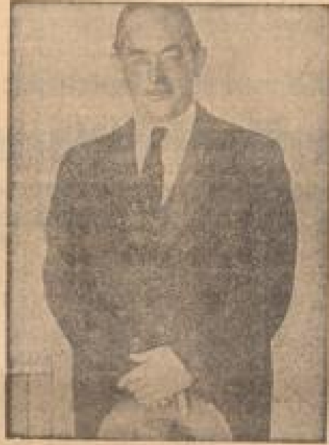
Sudanesischer Verteidigungsminister kommt nach Berlin