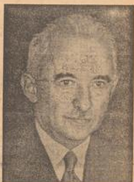
Der neue türkische Staatspräsident

Der Sudanesischer Verteidigungsminister wird der tschechische Verteidigungsminister in Berlin eintrifft. Er wird am Donnerstag in Berlin eintrifft.