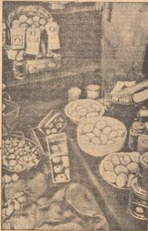
So hamstern die Juden!

Der Jude Abraham im Kellergarage hat, wie dieser Bild zeigt, so reichlich, als er hätte sein, die Lebensmittel als in seiner Kellergarage zu beschaffen. Er kauft heute mehrere Teller, eine, zwei und drei Teller.