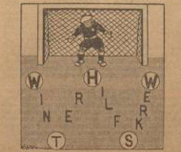
Waldhof Waldhof 1:2

Das Ergebnis von heute ist ein Erfolg für die VfL Mannheim, deren Spieler teilweise aus dem VfL Waldhof stammten.