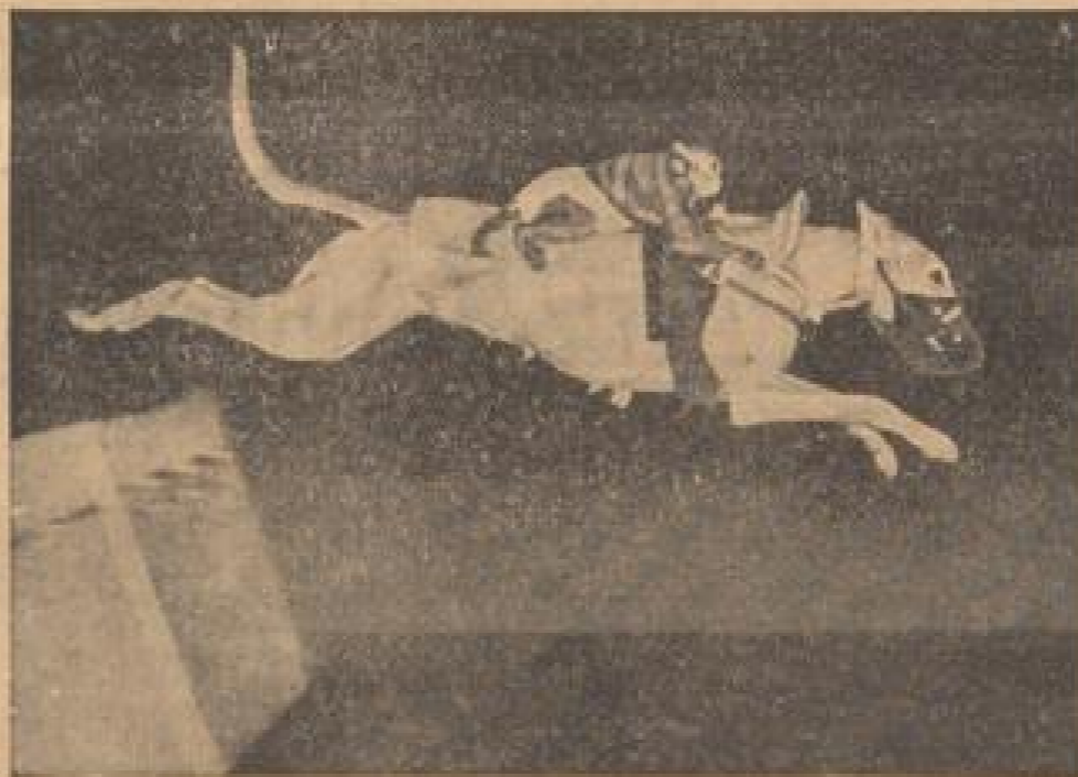
Geppel! Diese Wile, scheint ein guter Helfer zu sein, denn bei der großen Show, die kürzlich in Weiburg stattfand, konnte selbst die mildeste Quidenprüfung des Wappens ihn nicht abhalten.