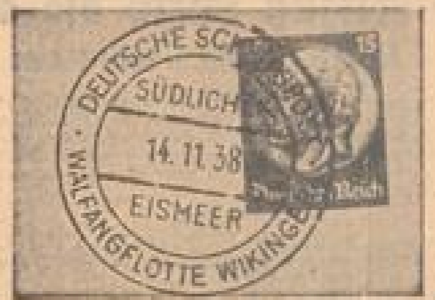
Walfängerstempel der Deutschen Reichspost Die ersten Postläufer mit dem „Walfängerstempel“ sind nunmehr von der Reichspost her zur Weltauspostung in die Heimat gelangt.

Wald in Wien: Eindringvögel Rekrutens Bereidigung Auf dem Wiener Feldberg wurden die Rekruten des Bundes der Jäger auf den Führer und Reichsführer vorbereitet. (Eberl, Biederstein, Jander-Phototyp-Dr.)