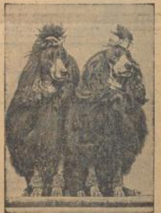
Mit Perücke und Subito! Ihre Haare von ihrem Friseur gekürzt, waren diese beiden, zunächst, einer Unmöglichkeit auf den Weg einer Schönheitsparade. Sie können ihre eventuelle Haare nicht gleich genug haben.