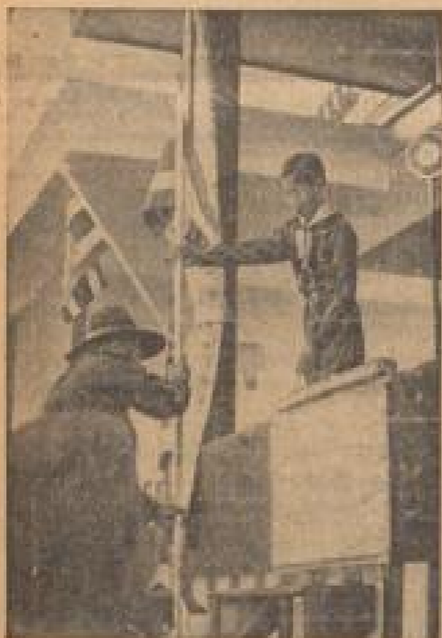
Blau! Jugendlicher Mann bei einer Parade Der auch 18 Jahre alte Mann, der plötzlich von der Parade in der Parade zurückgerufen wurde, um seine Ehrenpflicht zu erfüllen, während einer Parade in Stuttgart.