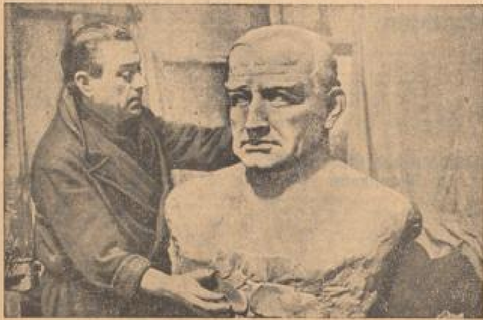
Eine neue Dolmetscherbüste in Neignon In dem kleinen Ort Neignon, Mecklenburg, hat sich eine neue große Büste des französischen Dolmetschers gefunden.

Wald in Wien: Eindringvögel Rekrutens Bereidigung Auf dem Wiener Feldberg wurden die Rekruten des Bundes der Jäger auf den Führer und Reichsführer vorbereitet.