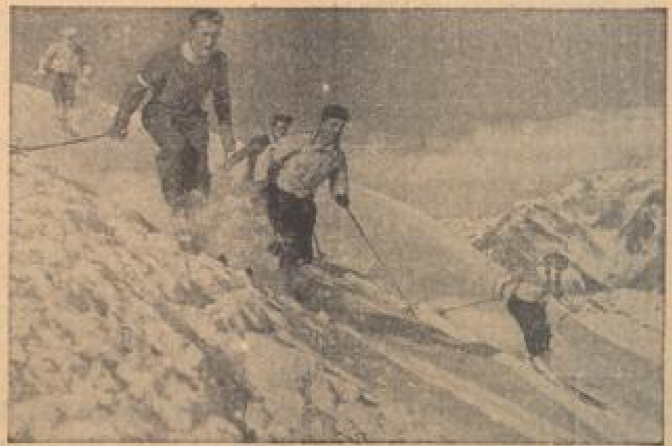
Am Arlberg ist schon Winter! Eine neue Aufnahme von Arlberg, wo schon vorläufige Schneeschichten herrschen. Von dieser Höhe aus Richtung Innsbruck mit vorläufig nur schneebedeckten Gipfeln.