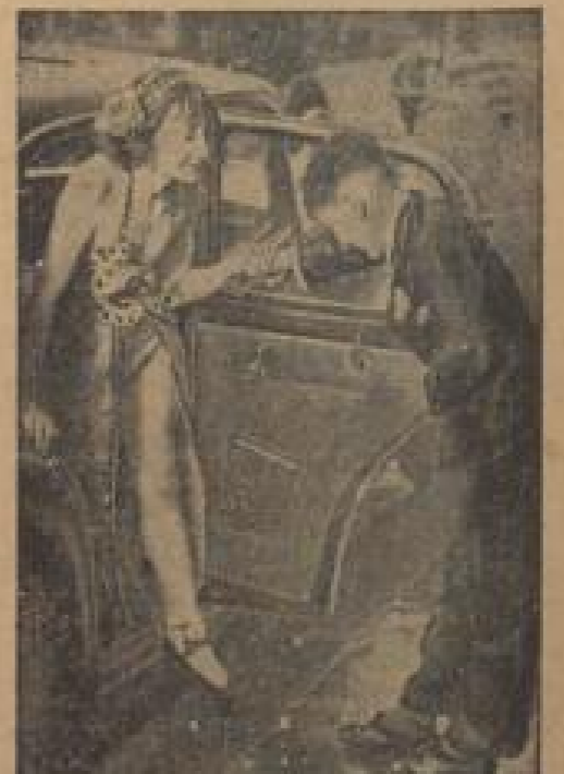
Ein bißchen „Inflig“ für Dezember! Dinge ...