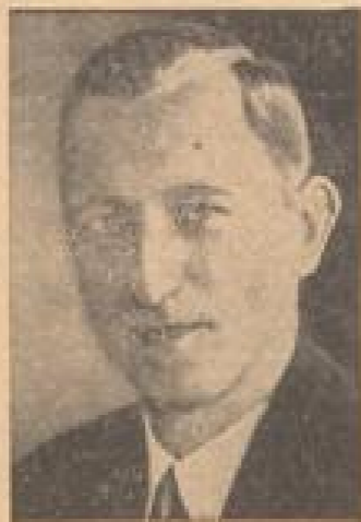
Der neue Gouverneur des Mecklenburgs Der künftige Reichspräsident Brüning hat den Mecklenburger Viktor Weiland zum neuen Gouverneur des Mecklenburgs ernannt.