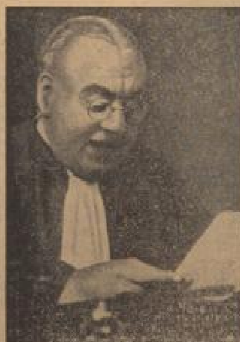
Der Herr ... ... der ...