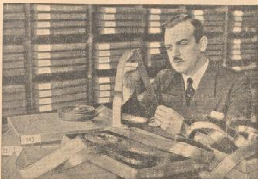
Der Film aus dem Reichsfilmarchiv, dem ersten Filmmuseum der Welt, das in Berlin-Zoo gebaut wurde...