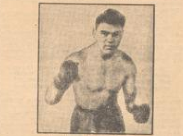
Der Sieger: Max Schmeling

Der Kampf wurde am 20. August 1934 in Hamburg im Hamburger Stadion ausgetragen. Max Schmeling gewann durch technischen K. o. in der neunten Runde.