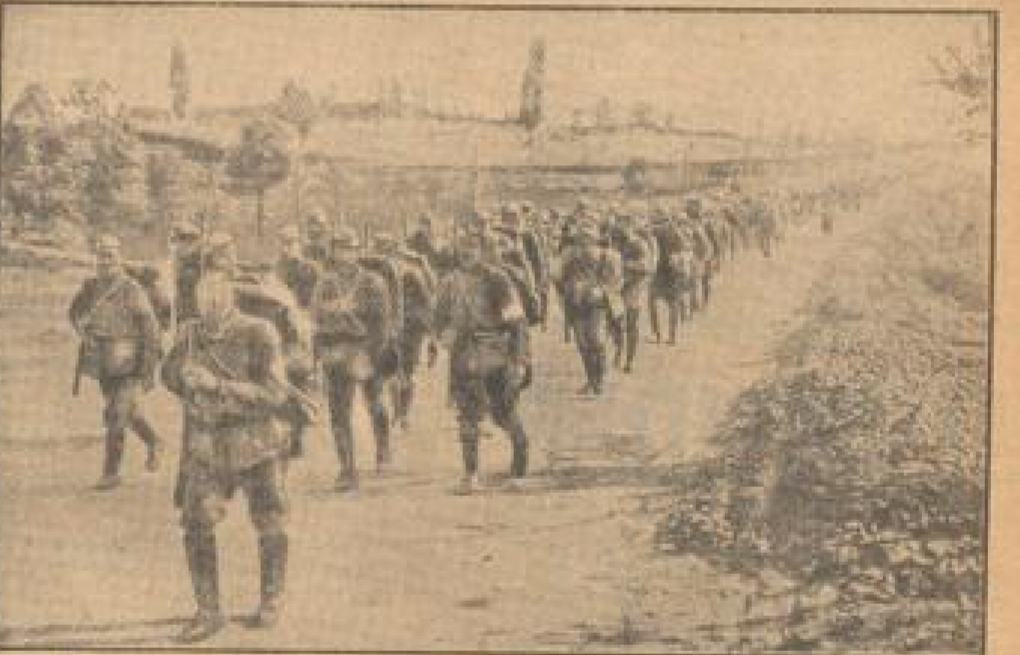
Griechische Regierungstruppen auf dem Marsch ins Aufstandsgebiet.