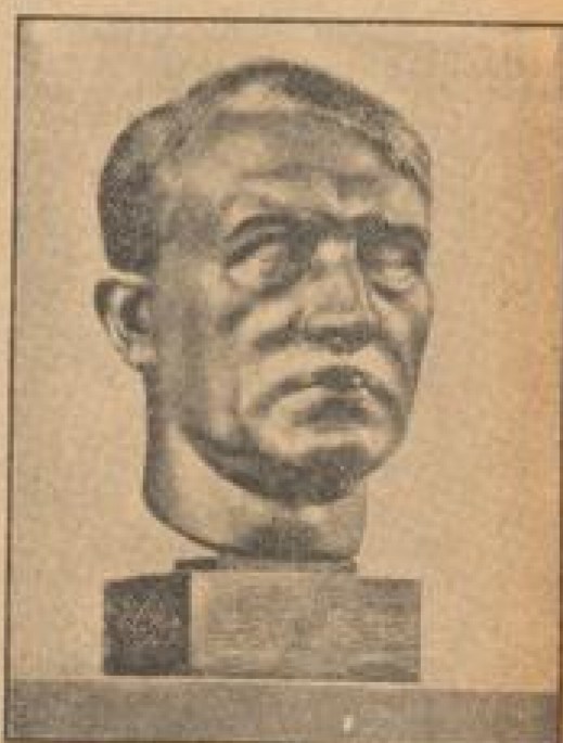
Eine neue Wüste des Führers. Die von der Bildhauerin Hedwig Warko Leo geformte Wüste.