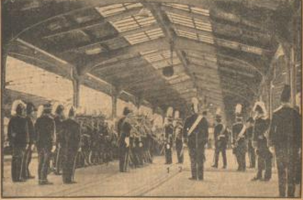
Das Kaisertrreffen in Tokio. Kaiser Kaname von Mandchurien (l.), der dem Kaiser Hirohito von Japan (r.) einen Besuch abstattet, bei seinem Eintreffen auf dem Zentralbahnhof in Tokio, wo ihm die Kaiserin des japanischen Volkes durch seinen Wahlsitzer begrüßt wurden.