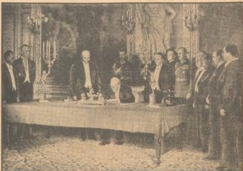
Die feierliche Unterzeichnung der neuen polnischen Verfassung, die im Reichstag durch Staatspräsident Pilsudski vollzogen wurde. (Mitte neben dem Präsidenten Ministerpräsident Cielicki, rechts die Mitglieder des Ministerrats.)