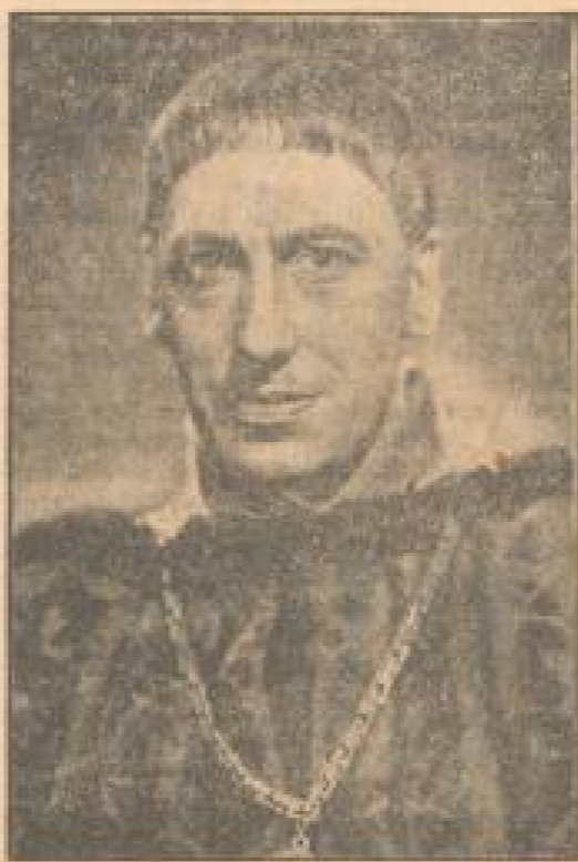
Helga Thiele als Johanna d'Arc