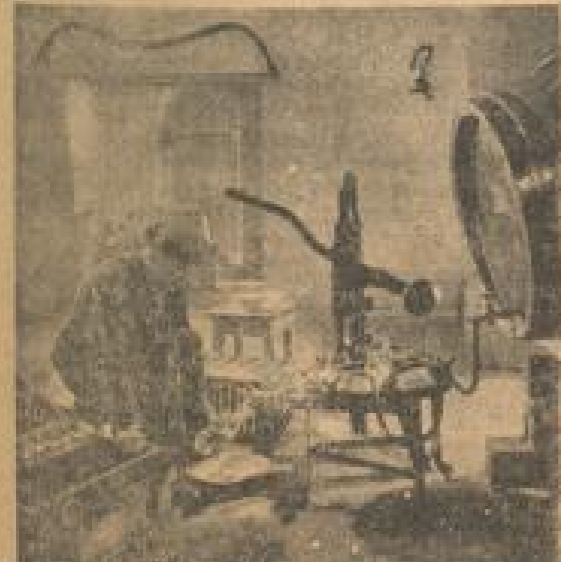
Im für einen Brand von 2 abzugeben, so erfolgt die Abfüllung in Flaschen über einen Asbest-Trichter über und das Verschließen mit der Korkmassel.