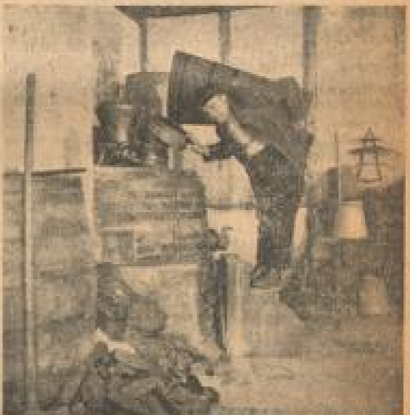
Über schüttet der Bauer die Maische aus seinem „Stängel“ in die Brennblase.

Denn das Weinen verfahren freilich die Wälscher, die Oberrhein oder Rheinländer, die Wälscher und Wälscher.