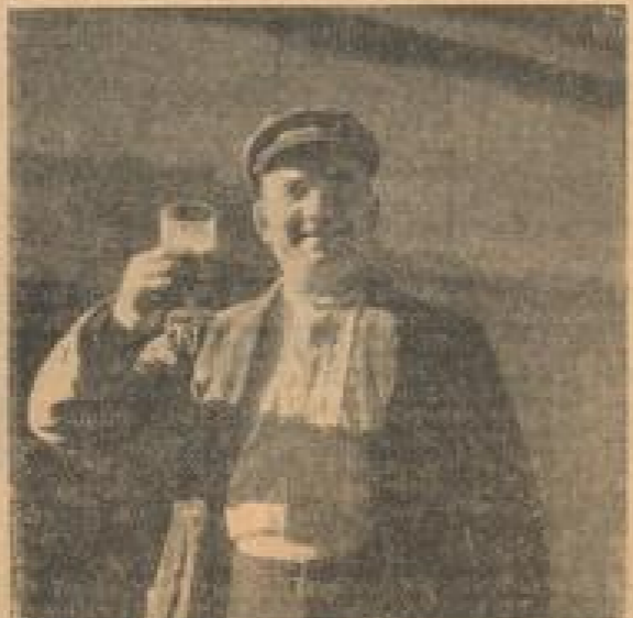
Probieren geht über Studieren! Kirschwasser soll man nur aus großen, kühlt u. zur Hälfte gefüllten Gläsern trinken. Der rechte Brenner kostet dafür gleich aus dem Weinglas.