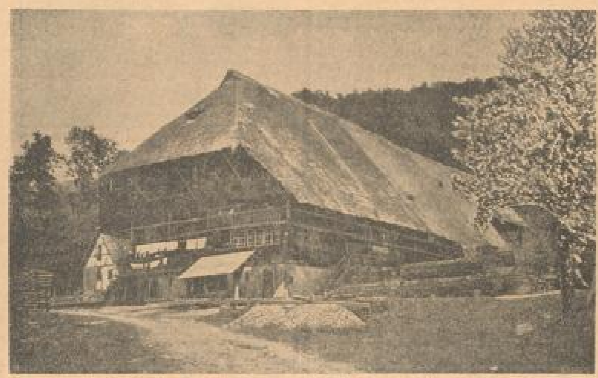
Vor einer dunklen Wand ragender Bergtaunen liegt das Schwarzwaldhaus im Schmuck der schimmernden Blüten.