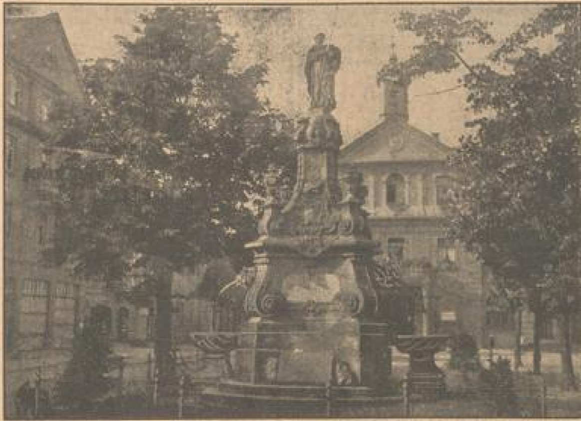
Blick auf den historischen Ursprungsbrunnen vor dem Schloss