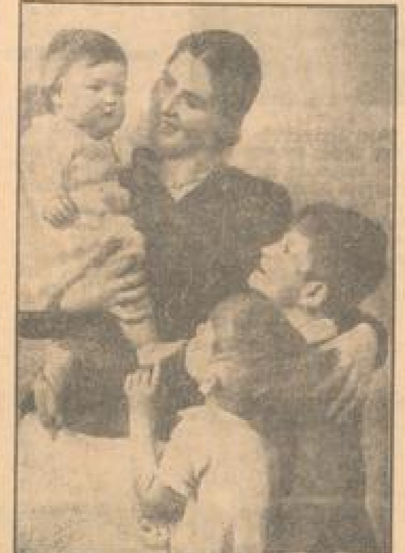
Abb. v. Joh. Selt