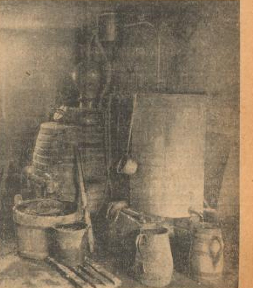
Die kleine bäuerliche Abflugsbrennerei in Tätigkeit: vor der mit Steinen vermaurerten Brennblase stehen die Bettelbe von Kirschweinsäure; rechts davon der Kühlstand, aus dem man das fertige Kirschwasser in die kupferbeschlagene „Stille“ rinnen sieht.