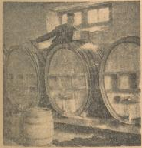
Der frischgebrannte Kirsch kommt in die reihenweise angeordneten Lagerfässer, wo er sich unter ständiger Aufsicht und Überprüfung des erfahrenen Kellermeisters etwa zwei Jahre lang ausbauen muß.

vielleicht zugleich das schaumige Weis der Kirscheblüte in den Käfern leben mag, — nach die Wälsche zurechtstern.