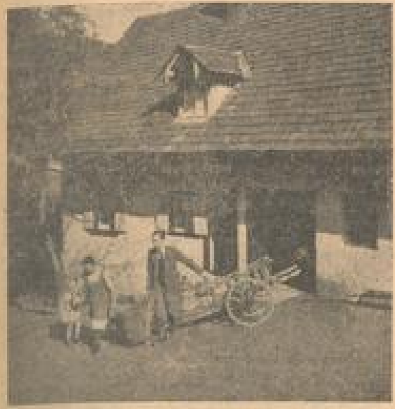
Da ein Großbetrieb mit seiner eignen Produktion nicht ausreicht, liefern die Bauern der ganzen Umgegend außer der Maische auch das schon fertig präparierte Kirschwasser in den bekannten Korbflaschen.

Im Juli, zur Zeit ihrer höchsten Reife, und bei recht profusum Wetter sind die Kirschen geerntet und möglichst ohne Stiel in die bis zu 800 Liter fassenden und meistlich lauberen Wälsch- und Wälscher gemessen worden. Je nach der Reifezeit haben sie sich bis zum Boden gedreht, um zu vergären, so daß der „Kuchen“ oben und die „Wälsche“ unten im Faß liegt. Nun ist aber der Zuckergehalt der Kirsche bis auf einen geringen Rest freigesetzt und kann im Laufe der nächsten Wochen oder Monate durch das Destillierungsverfahren in Alkohol umgewandelt werden. Gegenwärtig jedoch ist es dabei für Wohlgeschmack und Güte des Kirschweines von entscheidender Bedeutung, daß der Wassergehalt der Brennblase ein gewisses Maß nicht übersteigt. Man kann sogar sagen: Je größer die Brennblase, desto geringer das Aroma. In den alten Brennereien finden