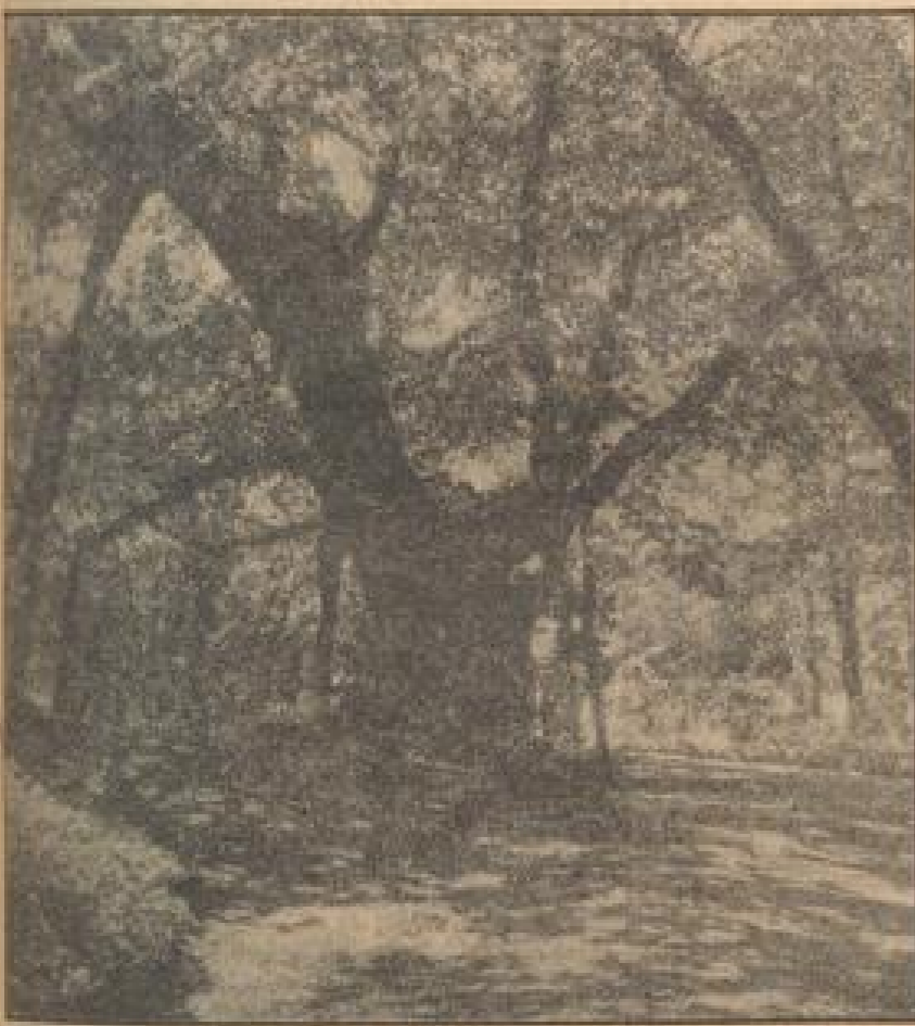
Die tausendjährige Zentraltür auf dem Heiligenberg