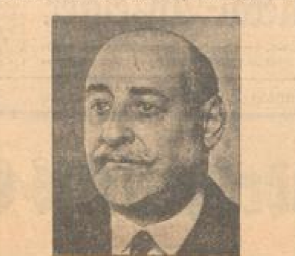
Der neue französische Ministerpräsident Bouisson