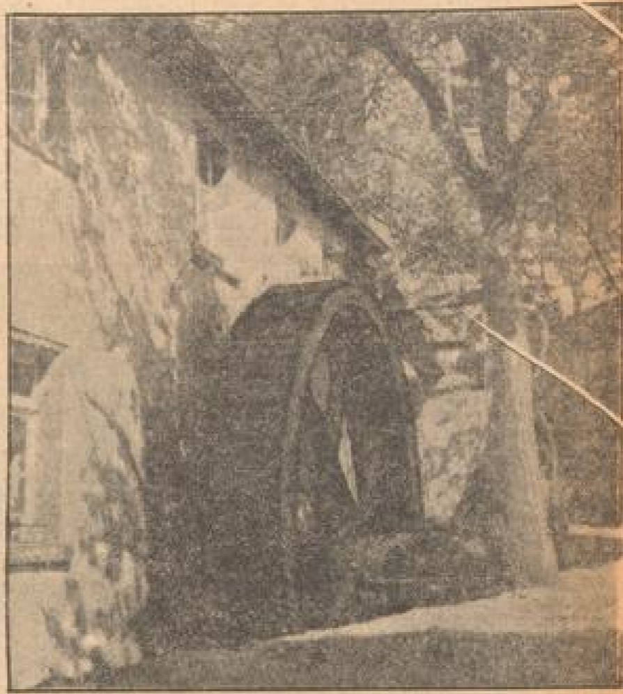
Eines der seltenen oberflächigen Wasserräder, das noch heute die Mühle im Orte treibt

Es wäre wirklich eine Sünde, an die fernabzuliegen, da das Wasser jetzt täglich mehr zu sportlicher Erfrischung leitet, die herrlichen Sommermorgens und die reiche Berglandschaft der ganzen Gegend ihren natürlichen Reizen noch ein besonderes Gepräge verleiht. Ob es nun die Herren von Burg Lannenberg oder die Ritter von Joffa sind, in deren Tage man zurückträumt — oder ob man sich gar gelegentlich ein bißchen Hoffentlich erzählen läßt, um den so mancher alleingelebten Jugenheimer zwischen 70 und 80 noch weiß; es sind dies gerade jene kleinen Reize, die das gerühmte Dasein des Kur-Sommerfrühling zur Höhe führen. Da hört man von der schönen Fürstin