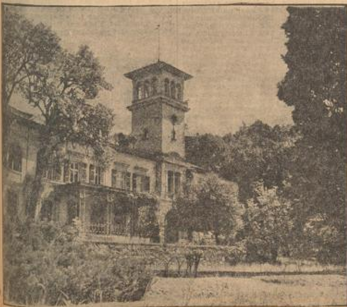
Das Sommerloß der heulichen Fürstlichen auf dem Heiligenberg, heute eine Führerschule der Hitlerjugend