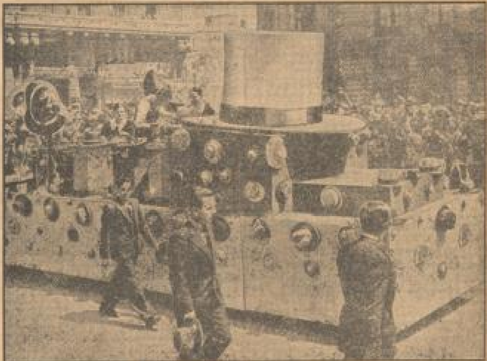
Die Entmacher vor dem Kaiserhof Königsplatz.

Wie weit in Frankreich der Gebrauch des Dutz- und Dutzdutz in die Berufsform einströmt, zeigt diese Aufnahme. Eine Pariser Studentin hat ihr geliebtes Personal mit Madrasse ausgestattet. Bevor die Studentin beginnt zu schreiben, werden die Madrasse-Becken mit Wasser gefüllt.