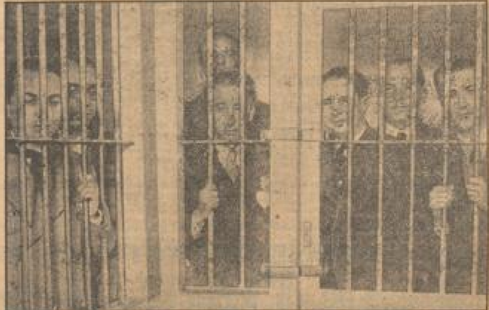
Die fatalistischen Aufständischen vor ihrer Aburteilung.

Ein Bild auf dem großen Marktplatz, den die Entmacher und Gewerkschaften der runden Gasse umgeben, zeigt verurteilte.