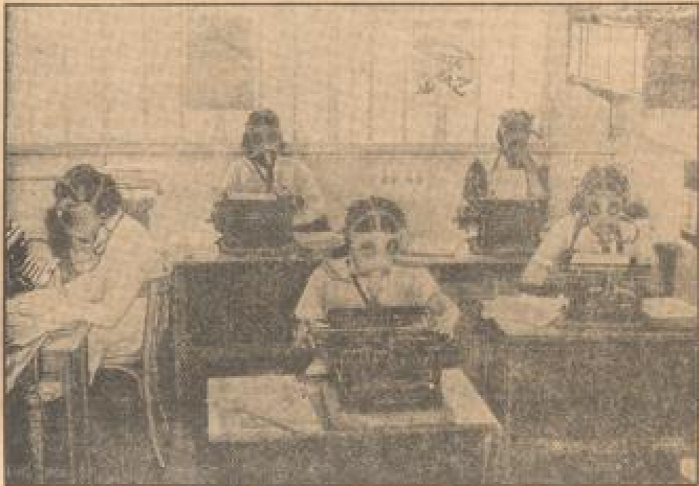
In Frankreich: mit der Madrasse an der Schreibmaschine.

Nach Belgegang des Seemannsbriefes hat der französische Postdampfer „Normandie“, der mit 7000 Tonnen das größte Schiff der Welt ist, den 26. Juni nach Amerika angefahren.