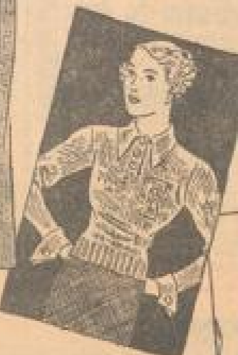
Spezial gestrichelte Pullover in verschiedenen Farben. Die Pullover sind in einem feinen Rippenmuster gehalten. Größe: 18-20 bis 22-24