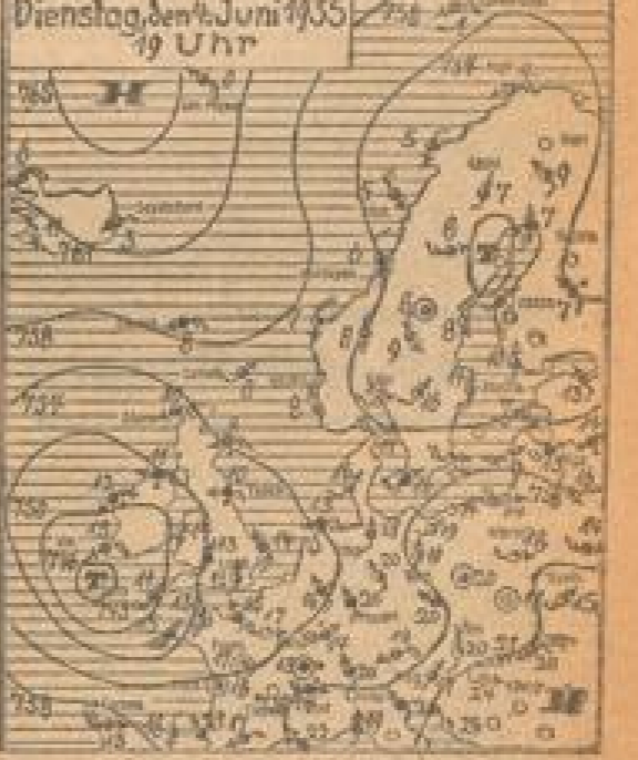
Wetterkarte der Frankfurter Univers.-Wetterzentrale