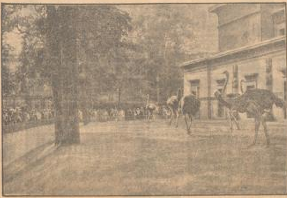
Das neue Reittier der Gitter im Parkhaus Zoologischen Garten, das den Reiter durch eine weitausgehende Bewegungsfreiheit und den Reiter eine bessere Beobachtungsmöglichkeit gibt.