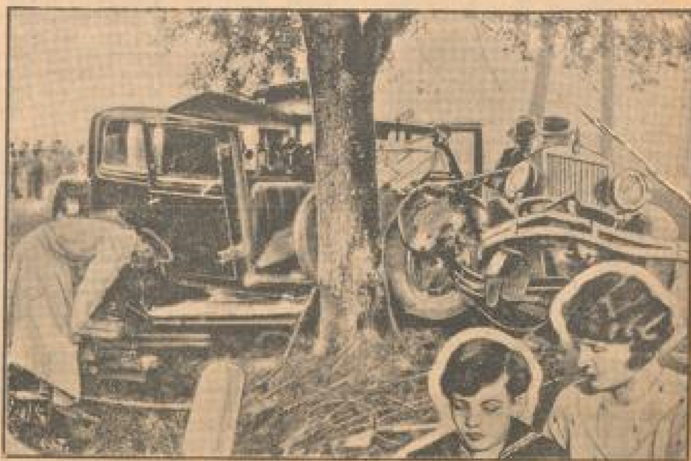
Das Antonoglud des österreichischen Bundeskanzlers