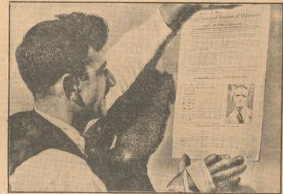
Ein Käufer wird angeprangert

Im alten Reichstheater in Berlin in der englischen Straße 19 eine Befanntschaft angeknüpft worden, die die Befanntschaft und die Photographie des schändlichen Käufers des Reich enthält. Der Hund dieser Befanntschaft ist die Befanntschaft des Reiches, einem Geschlechtsständiger Militär zu geben, und soll gegen dieses Verbot handeln, legt 10 Monate Befanntschaft an.