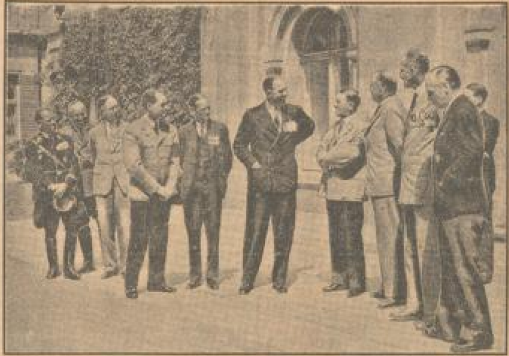
Die englischen Frontkämpfer, die zur Zeit ihren deutschen Kameraden einen Besuch abkriegen, um bei uns neue Uniformen zu empfangen, wurden vom Kommandanten ...