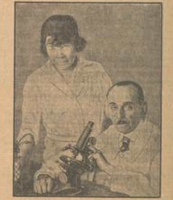
Ein Serum gegen Typhus gefunden? Das französische Institut für Hygiene...