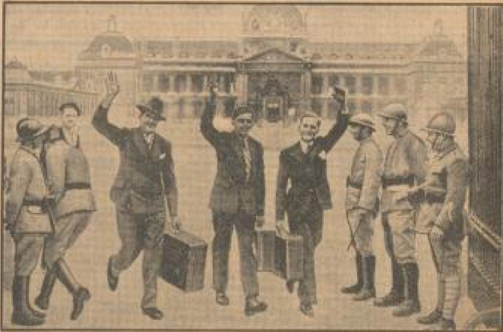
Der französische Jahrgang 1913 entlassen

Im Frankreich ist die Jahrgänge 1913, die noch einjähriger Dienstzeit im April 1933 hätte entlassen werden müssen, jedoch aus Grund eines besonderen Gesetzes drei Monate länger unter den Waffen gehalten worden war, jetzt zur Entlassung gekommen. So sind die Rekruten einige Wehrübungen, die in der üblichen überrückten Stimmung einer Partier Salece verlaufen.