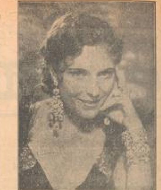
Clara Viebig in dem Film "Arbeitsrat", der gegenwärtig in der Volk- und Theaterkino in Mannheim gezeigt wird.

Schriftstellerin zur Künstlerin macht, das kann die Frau nicht erzählen." Es ist die Erfüllung ihres Prosaentums in der Richtigkeit, die auch ihrer Kunst die rechte Erfüllung und die geschlossene Form gibt. Aus einer mütterlichen Haltung zur Welt erwächst Clara Viebigs Weltanschauung und Werk.