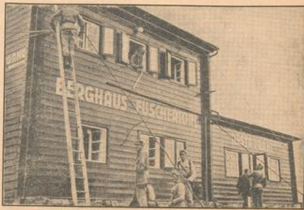
Vorbereitungen zum ersten Großlodner-Rennen.

Am 1. August wird das Internationale Großlodner-Rennen auf der neuen Kletterfahrbahn — der höchsten Kletterfahrbahn — gefahren. Die technischen Vorbereitungen dafür sind im vollen Gange. Zu merken, wie die Aufnahme zeigt, bereits 1931 die Veranstaltung gefeiert. (Wetzlar, 21.)