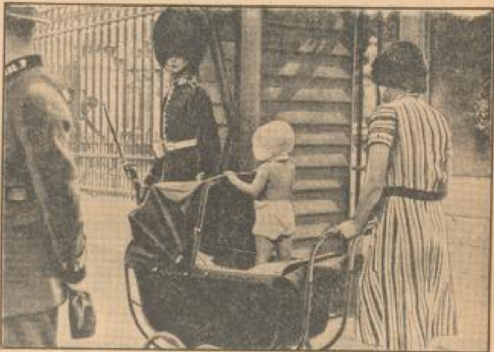
Die große Attraktion!

Am 1. August wird das Internationale Großlodner-Rennen auf der neuen Kletterfahrbahn — der höchsten Kletterfahrbahn — gefahren. Die technischen Vorbereitungen dafür sind im vollen Gange. Zu merken, wie die Aufnahme zeigt, bereits 1931 die Veranstaltung gefeiert. (Wetzlar, 21.)