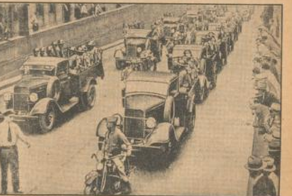
Schnelltransportlieferung in der amerikanischen Armee.

Ein Jubiläum von der Natur der Jachten zur Regatta von Garmouth, in der jetzt wieder die besten Segler Europas teilgenommen haben.