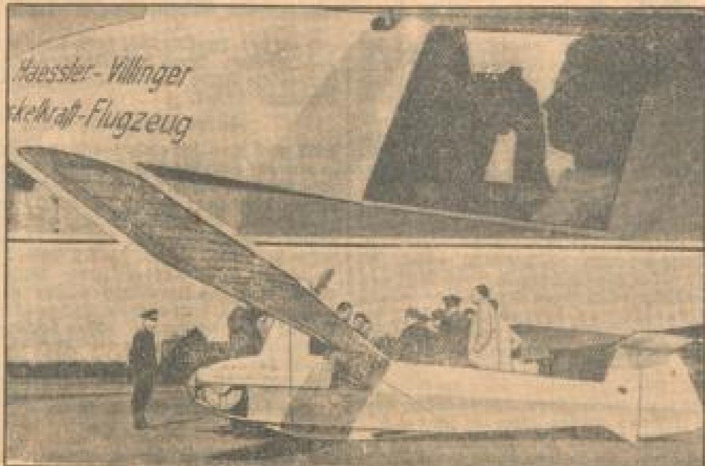
Das in Deutschland konstruierte Menschkraftflugzeug nach seinem ersten erfolgreichen Flug, den der Pilot T. ...