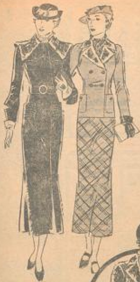
Wendel mit breitem, metallischen Schmuckband. Dunkelblau. Illustriert von G. Schmitt. M 2294