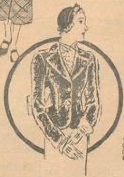
Schöne, hellfarbige, weiche Stoffe. Dunkelblau. Illustriert von G. Schmitt. M 2296