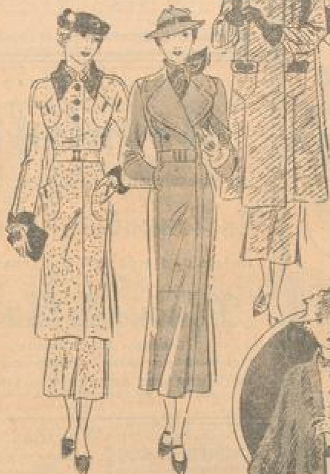
Sehr hübsche, hellfarbige Stoffe. Dunkelblau. Illustriert von G. Schmitt. M 2297