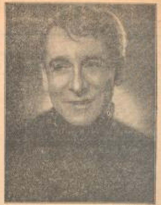
Paul Kemp in dem Film „Der müde Gefährte“...