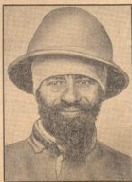
Der „Held von Adua“

London, 1. Okt. Die Stadt Gibraltar und ihre Umgebung waren am Donnerstagsabend 20 Minuten lang völlig verunkelt, während gemeinsame Flotten- und Militäreinheiten abgehalten wurden.