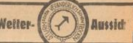
Wetterkarte des Luftwaffenamt Frankfurt a. M.