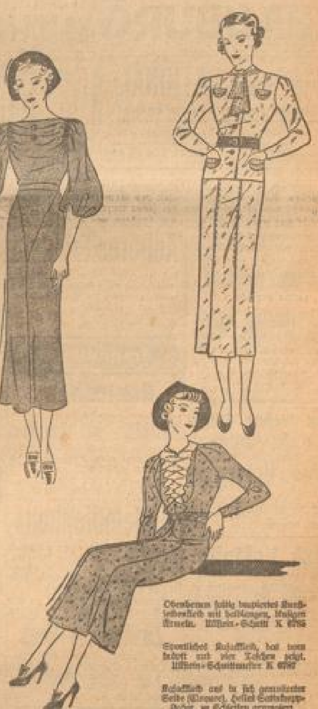
Mod. mit Blau als wertvolle Ergänzung. Helles - Schattenspiel K 477 und K 2166.