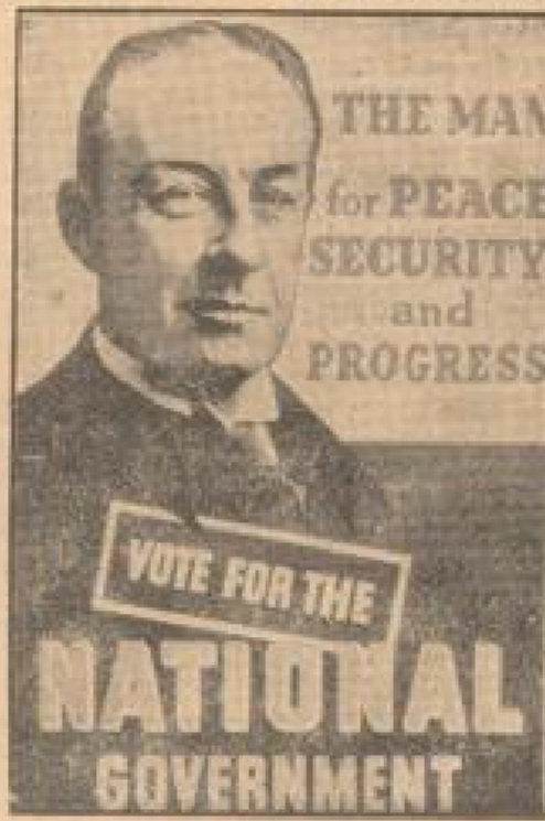
Wahlklocht hat im Zeichen des folgenden Wahlkampfes. Die ersten Plakate der Nationalregierung (englische Verfassung, II.)