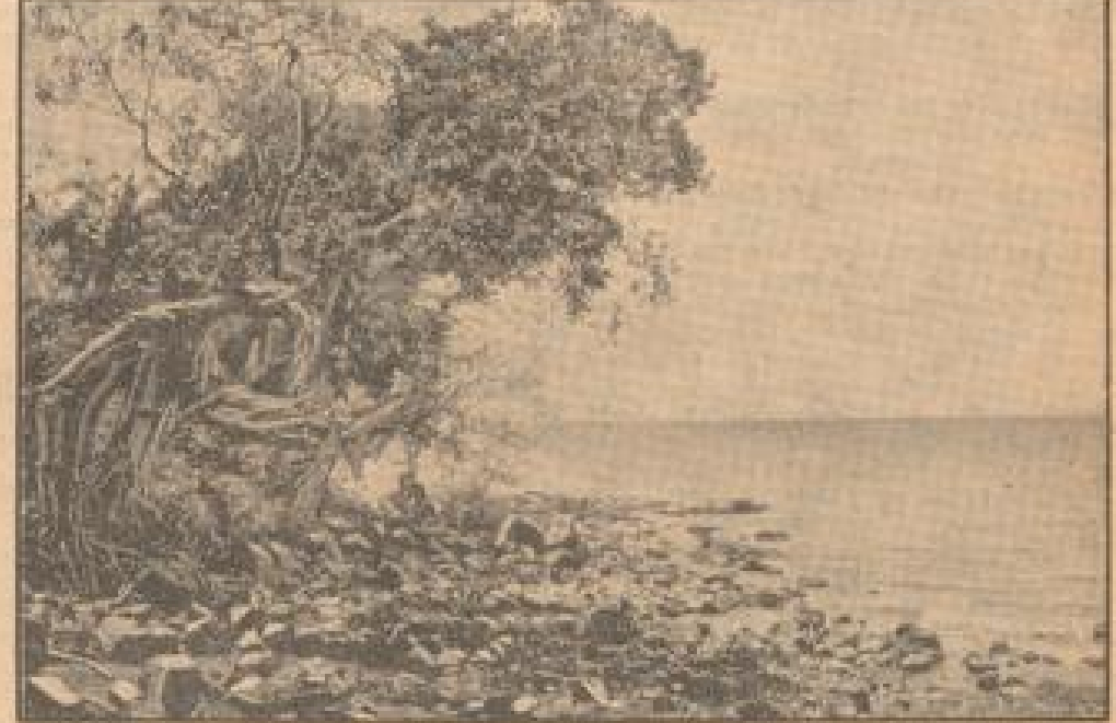
Eine der westlichen Aufnahmen, die über den Tana-See nach Europa gelangten. Der Tana-See ist das wichtigste Gewässer, das den Völkern des Ostafrikas den Reichtum der italienischen Kolonien im Ostafrika sichert. (Sonderbericht)