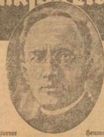
Herr Dr. Heumann's Thomsen-Tabletten