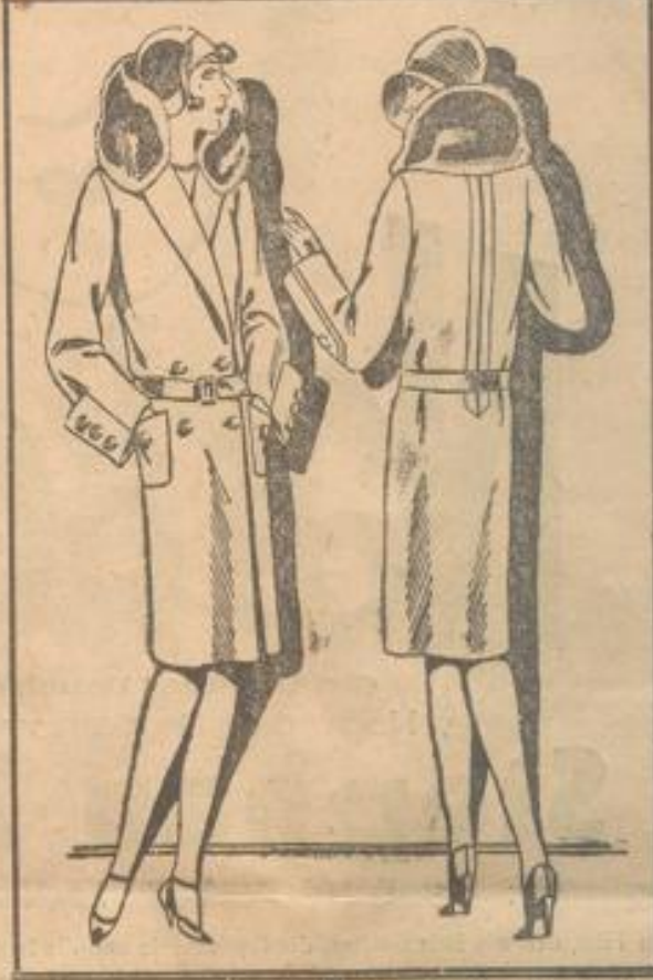
Englischer Mantel mit groß. Biberettekragen aus ganzen Fellen . . . 22.50