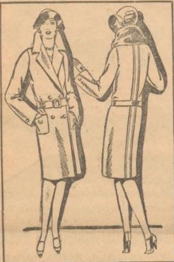
Flotter Uebergangsmantel Lhaltb. Fantasie-stoff, Rundgürtel 9.75

FÜR HERBST UND WINTER UNBEDINGT MASSGEBEND!