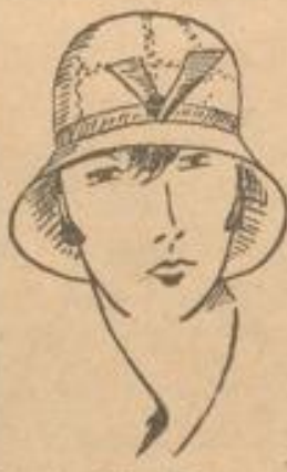
Fesche Filzlocke mit gepreßtem Muster Ripsband-Garnitur . . . . . 3 75