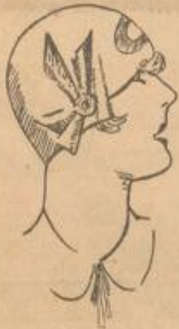
Elegante Filzkappe mit Pannegarnierung und Schleife . . . . . 8 90