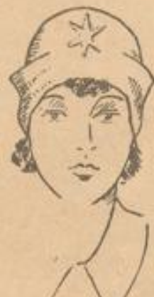
Die neue weiche Filzkappe . . . . . 2 95