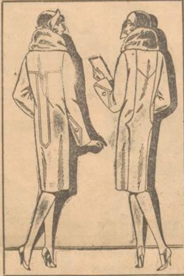
Flotter Ottomane - Mantel mit Plüschkragen . . . 12.50