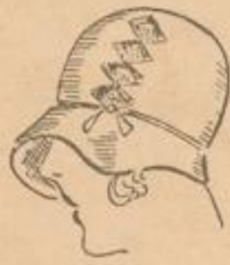
Weiche Filzlocke feiner Modell-Genre . . . . . 10 75