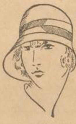
Moderne, tiefe Filzlocke mit zweifarb. flatter Bandgarnierung . . . . . 7 90