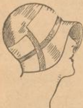
Jugendliche Filzlocke mit zweifarb. Stumpfen verarbeitet . . . . . 6 90