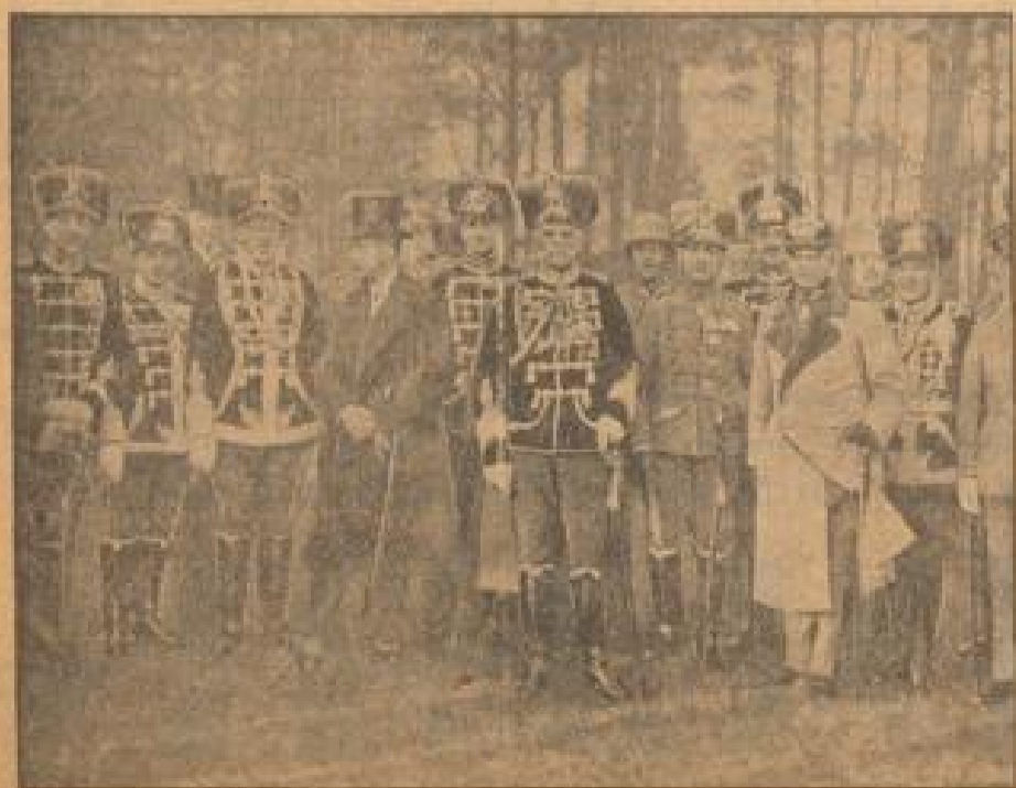
Der große Heerführer im Kreise seiner Regimentskameraden. Am 10. Geburtstag des Generalfeldmarschalls von Mackensen haben sich auf dem Foto Kameraden des Regiments getroffen, um dem Feldherrn ein, unter deren die ehemaligen Regimentskameraden von Mackensen in seiner Kameradenzeit.