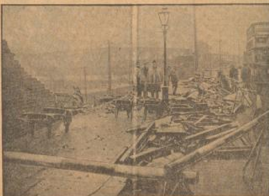
Verwüstungen am Themseufer. London wurde hier Tag durch einen Mörner Orkan heimgesucht, der mit einer Geschwindigkeit von 120 Kilometern über die Stadt hinwegzogen und überall die überirdischen Verwüstungen anrichtete.